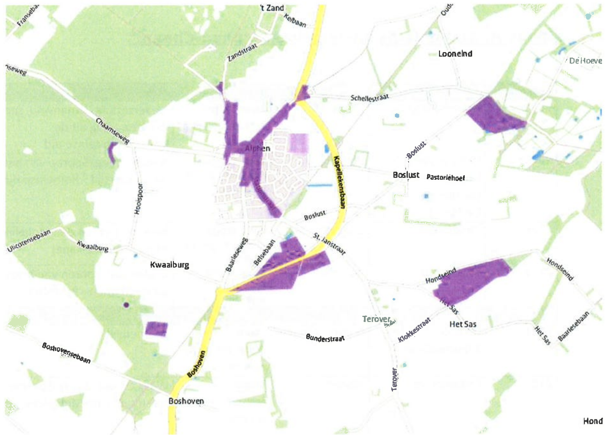
Uitsnede Archeologische Monumentenkaart 2 d.d. 9 juni 2015, Alphen