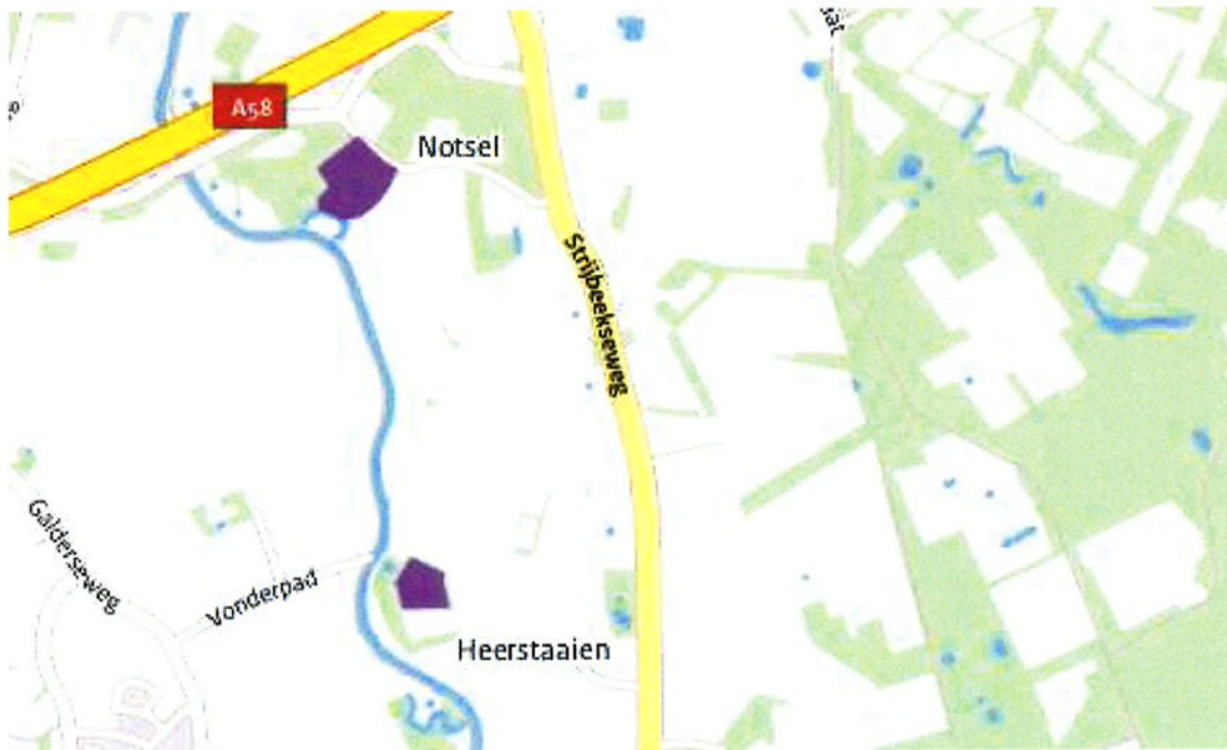
Uitsneden Archeologische Monumentenkaart 3 d.d. 9 juni 2015, Chaam en Strijbeek