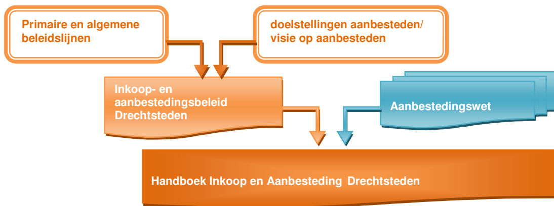
Fig. 2 Onderlinge verhouding beleid, wet en handboek

Het Inkoophandboek wordt opgesteld en actueel gehouden door team Inkoop en juridisch getoetst door het Juridisch Kenniscentrum van het Servicecentrum Drechtsteden.