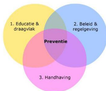
Figuur 1: Pijlers alcoholmatigingsproject 'Laat je niet flessen'

Effectief preventiebeleid is van groot belang, alsmede effectieve handhaving door gemeentelijke toezichthouders is een belangrijke schakel om de naleving van de DHW (onder andere de nieuwe leeftijdsgrens) te vergroten. Preventie en handhaving zijn onlosmakelijk met elkaar verbonden. Dit nieuwe Preventie- en Handhavingsplan 'Alcohol' biedt dan ook een uitgelezen mogelijkheid om preventie en handhaving met elkaar te verbinden. Dit komt zowel ten goede aan de gezondheid van de inwoners van Veldhoven als aan de preventie van alcoholgerelateerde problemen rond veiligheid en overlast, zoals vernielingen en geweld. De figuur hieronder illustreert de pijlers van het alcoholmatigingsproject 'Laat je niet flessen' en de verbinding tussen onder andere preventie en handhaving.