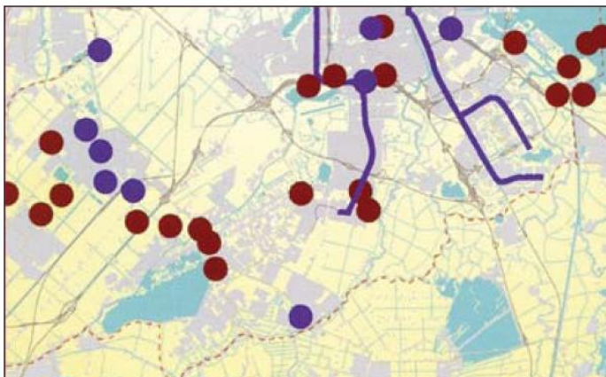
Figuur 2.5: Ontbrekende schakels in het netwerk fiets en stallingen bij OV-haltes