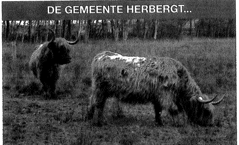
Ze werken stug door aan het behoud van de Jilt Dijkseide onder Opende, deze Schotse hooglanders. Ze zijn "in dienst van" Staatsbosbeher.