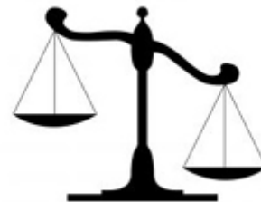
Figuur 4: Gedogen, een afweging van belangen

Voor het gedeelte dat gedoogd wordt, dient er sprake te zijn van een bijzondere omstandigheid zoals bij de 'reguliere' gedoogbeschikking. Met andere woorden het toetsingskader van het gedoog gedeelte van de partiële handhavingbeschikking is identiek aan dat van de gedoogbeschikking; namelijk passend binnen het gedoogkader. De regel blijft dus dat een handhavingsbesluit gericht moet zijn op het volledig beëindigen of ongedaan maken van (de gevolgen van) een overtreding, tenzij er sprake is van 'bijzondere omstandigheden'.