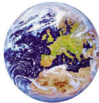
Figuur 1: De te beschermen omgeving

In hoofdstuk 6 staan de overlegstructuur en de informatie-uitwisseling beschreven en de rol van de provincie daarin. Daarnaast worden in dit hoofdstuk de situaties beschreven waarin meerdere bevoegde gezagen gelijktijdig of na elkaar bevoegd gezag zijn.