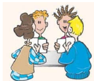
Figuur 5: Beter resultaat door samenwerken

In onderstaande tabel 5 zijn ook de overige overleggrema genoemd, met daarbij de belangrijkste kenmerken per overleg. Alle genoemde overleggen worden 'Wabo-breed' georganiseerd.