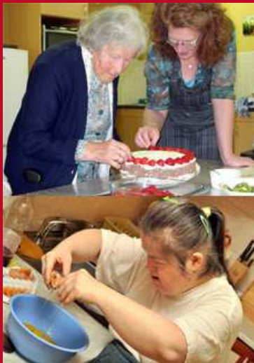
AWBZ / WMO