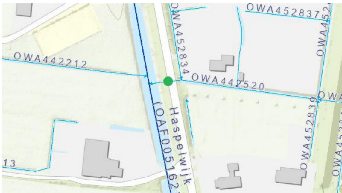
Figuur 1: De groene stip geeft globaal de locatie weer van de te vervangen dam met duiker.

Het dagelijks bestuur van het waterschap Noorderzijlvest heeft op 2 maart 2026 van [REDACTED] een aanvraag ontvangen om een omgevingsvergunning als bedoeld in artikel 5.1, tweede lid, van de Omgevingswet (Ow). De aanvraag betreft het vervangen van een dam met duiker nabij De Haspel 25 te Zevenhuizen, zoals hieronder globaal is weergegeven in figuur 1.