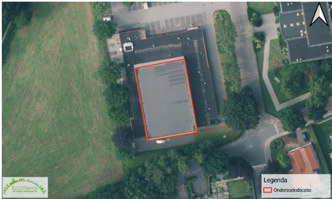
Figuur 1 Kaart van het plangebied (rood omlijnd). Adres van het plangebied is Molenweg 8 te Harskamp.