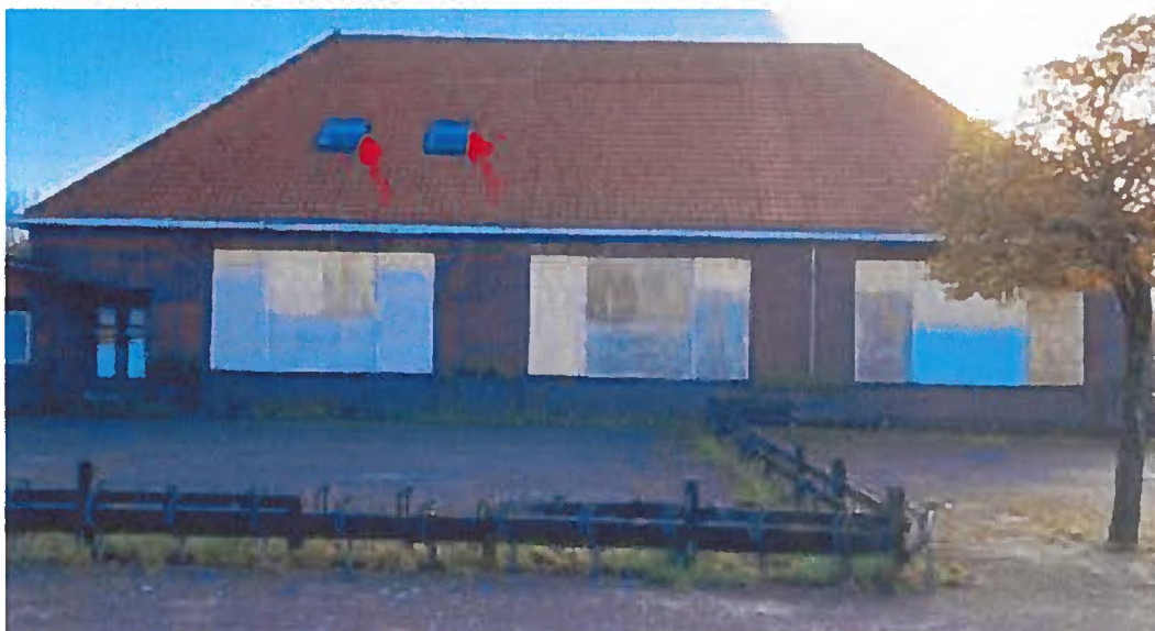
Figuur 3. Locatie van de broedparen huismus bij de dakramen aan de zuidwestzijde van het gebouw.