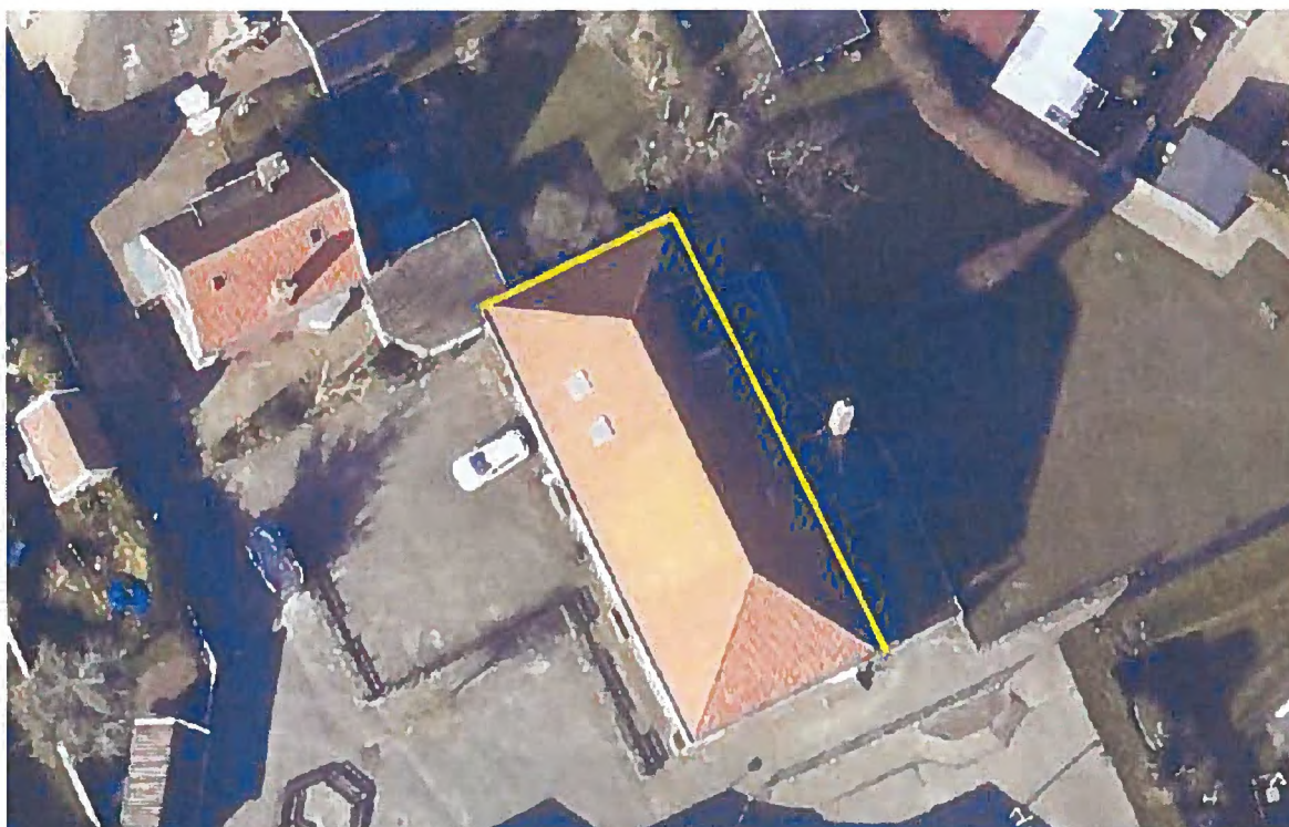
Figuur 3. De noordwest- en noordoostzijde van het dak (gele lijnen) waar de toe te passen vogelschroot naar de 3 e rij dakpannen wordt verplaatst ten behoeve van nestgelegenheid van huismus.