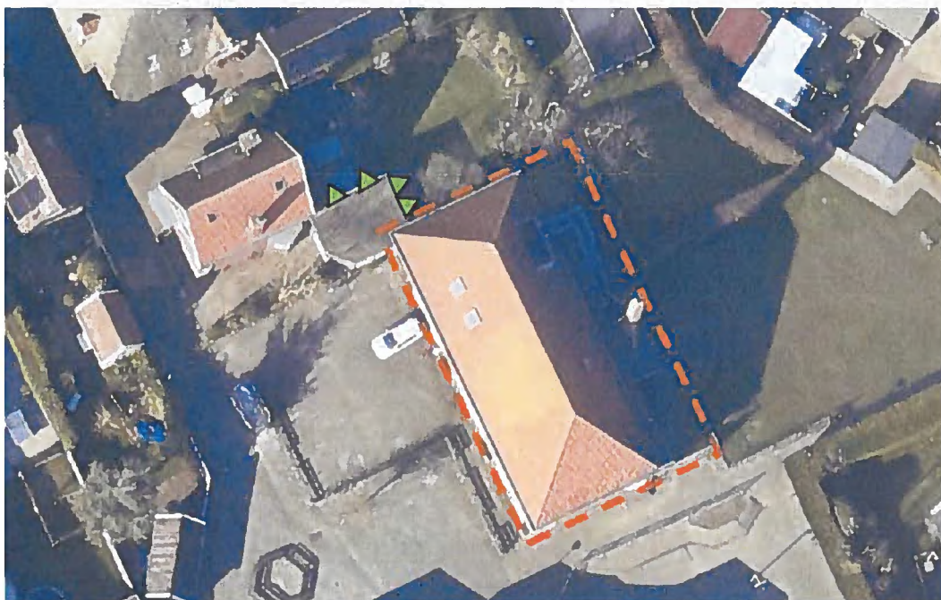
Figuur 1. Situering van de huismus-nestkasten aan de het bijgebouw van Butterhoek 3 te Hippolytushoef.