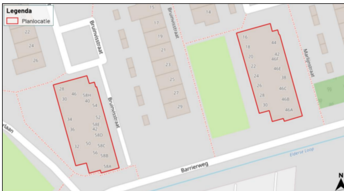
Figuur 1. Locatie aan de Bruinvisstraat en de Marlijnstraat te Helmond. De activiteiten vinden plaats binnen de omliggende gebieden.