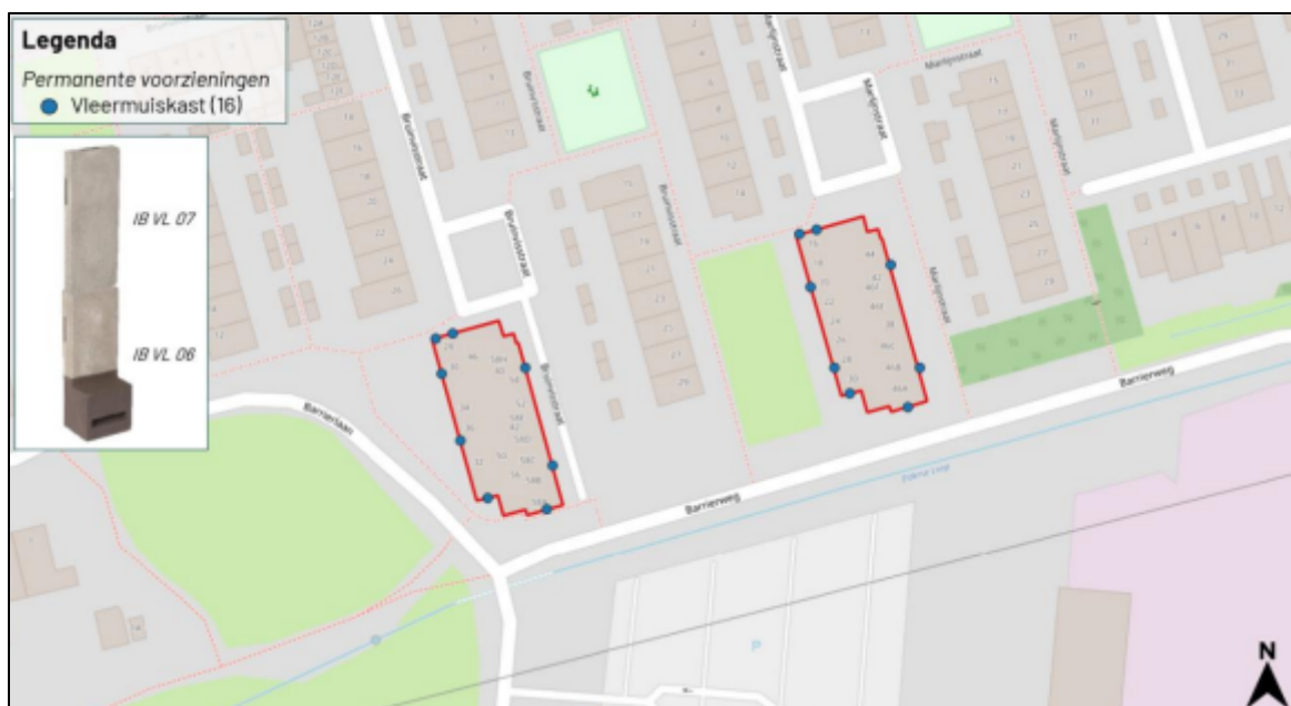
Figuur 3. Locaties van de permanente voorzieningen (blauwe stippen).