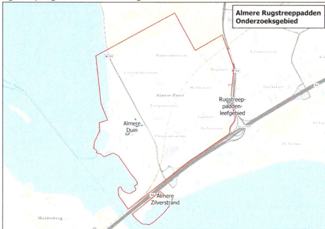
Figuur 1: plangebied met de drie leefgebieden