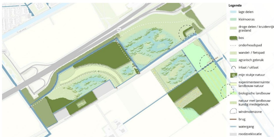
Figuur 1.1 – Ontwerpschets Noorderwold-Eemvallei

Stichting Het Flevo-landschap is voornemens om ten zuiden van de A6, ter hoogte van afslag 7 (Almere Buiten), een gevarieerd landschap aan te leggen dat ruimte biedt aan een mix van biologische landbouw, natuur en bebouwing. Dit wordt de Noorderwold-Eemvallei genoemd. In figuur 1 is de ontwerpschets hiervan weergegeven.