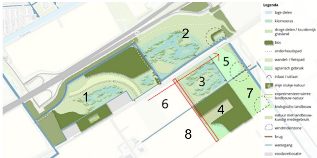
Figuur 2.1 – Ontwerpschets Noorderwold-Eemvallei inclusief aangegeven ontbrekende sloot in rood