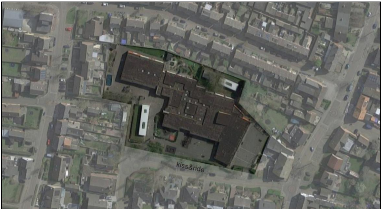
Figuur 1. Locatie aan de Meulenberg 6 te Ossendrecht. De activiteiten vinden plaats binnen het omliggende gebied.