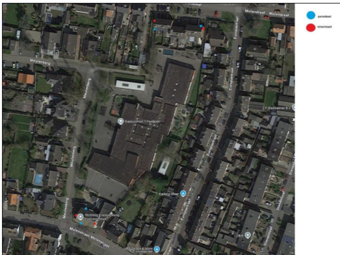
Figuur 2. Locatie van de tijdelijke voorzieningen.