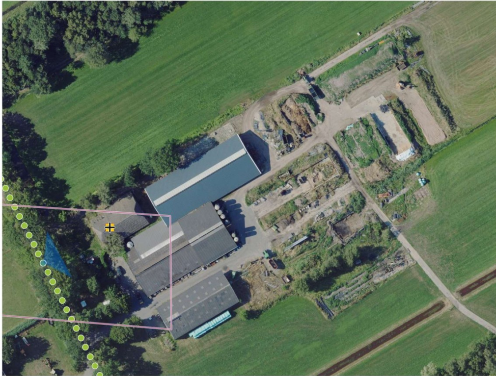
Figuur 1 Luchtfoto perceel Ruinerweg 58 te Koekange.

Een luchtfoto en topografische kaart met daarop de ligging van de locatie is in navolgende figuren weergegeven.