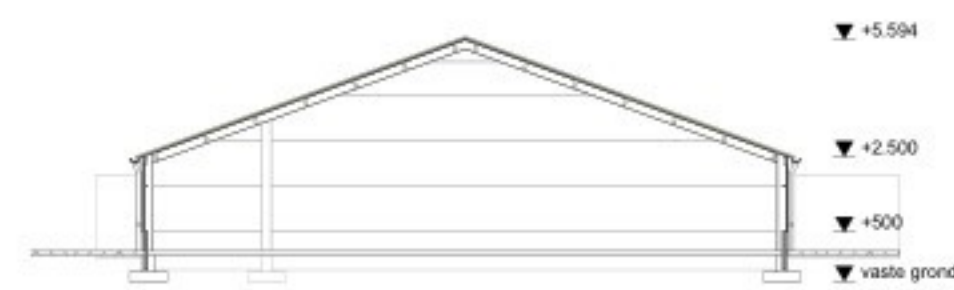
Doorsnede gebouw B