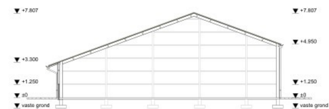
Doorsnede gebouw A