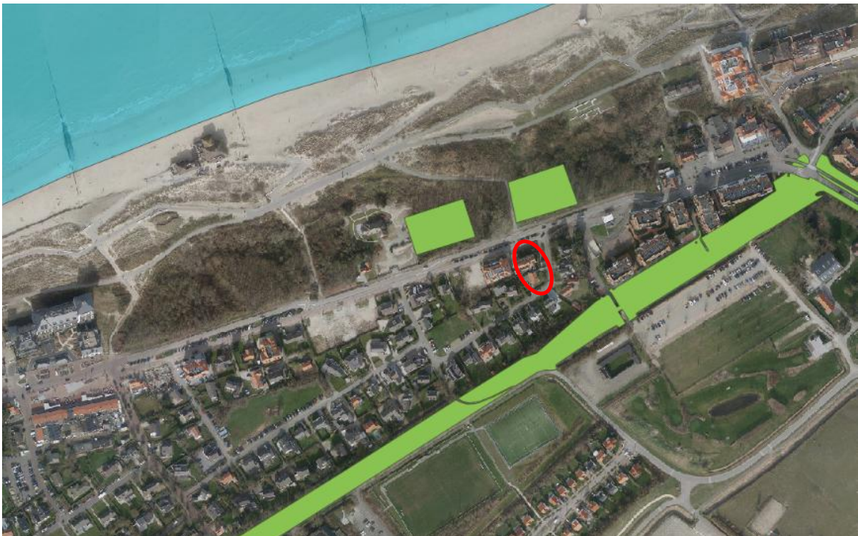
Afbeelding 2: Ligging projectgebied t.o.v. NNN

Het projectgebied is niet gelegen in een Natura 2000-gebied of in een NNN-gebied. Het dichtstbijzijnde Natura 2000-gebied 'Westerschelde & Saeftinghe' is gelegen op een afstand van circa 400 meter ten noorden van het projectgebied.