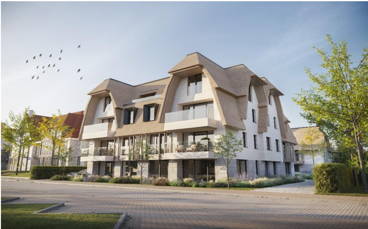
Afbeelding 3: Beoogde situatie Boulevard de Wielingen, gezien vanaf zuidelijke richting

In de beoogde situatie zal op beide percelen een appartementencomplex gerealiseerd worden, waarbij in totaal 19 appartementen (respectievelijk 14 en 5 in de twee complexen) zullen worden gerealiseerd. Het beoogde complex aan de Boulevard de Wielingen 24 omvat een begane grond en 3 verdiepingen, het achterliggende complex een begane grond en 2 verdiepingen. De twee complexen delen een ondergrondse stallingsgarage met elkaar, welke voorziet in 26 parkeerplaatsen.