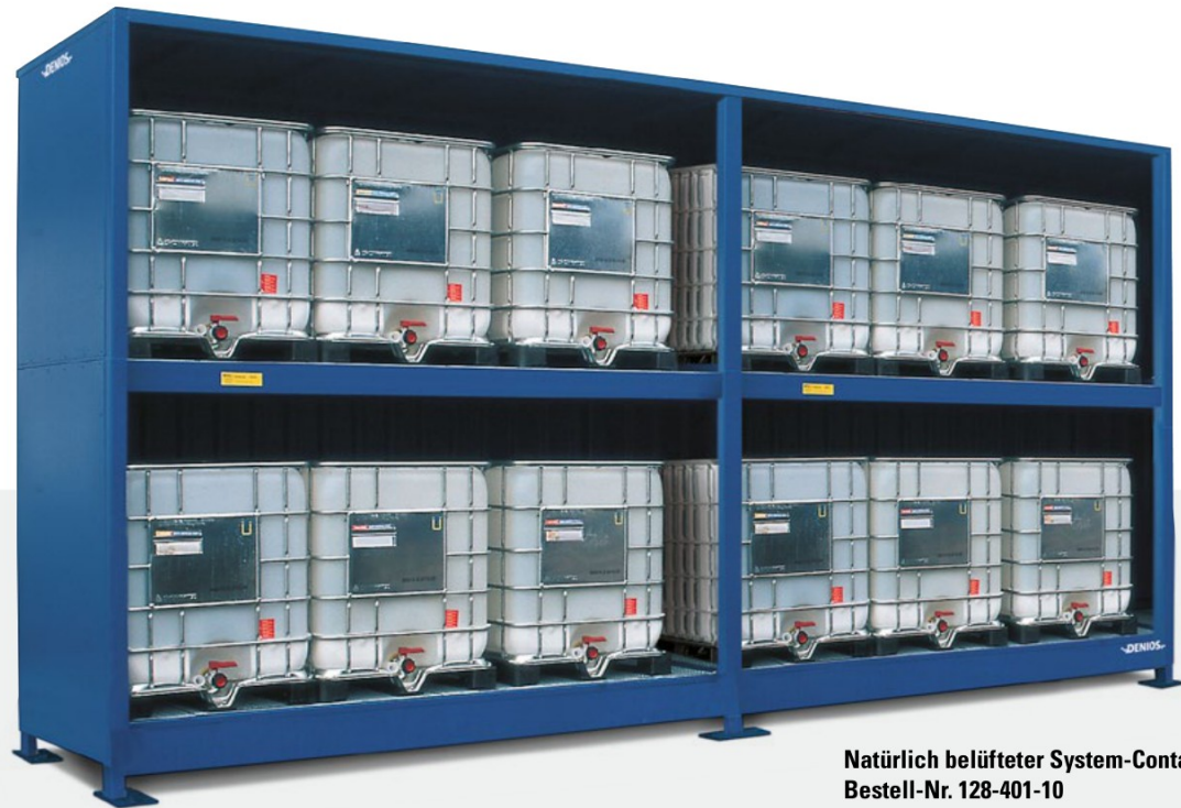
Natürlich belüfteter System-Container 2K 714.0 ohne Tore, Bestell-Nr. 128-401-10