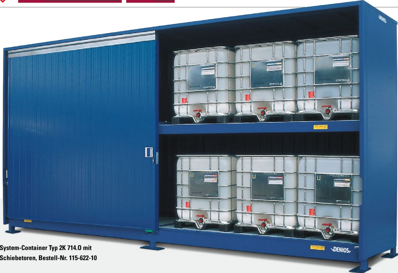
System-Container Typ 2K 714.0 mit Schiebetoren, Bestell-Nr. 115-622-10

Zubehörset bei Lagerung entzündbarer Flüssigkeiten (H224-226)