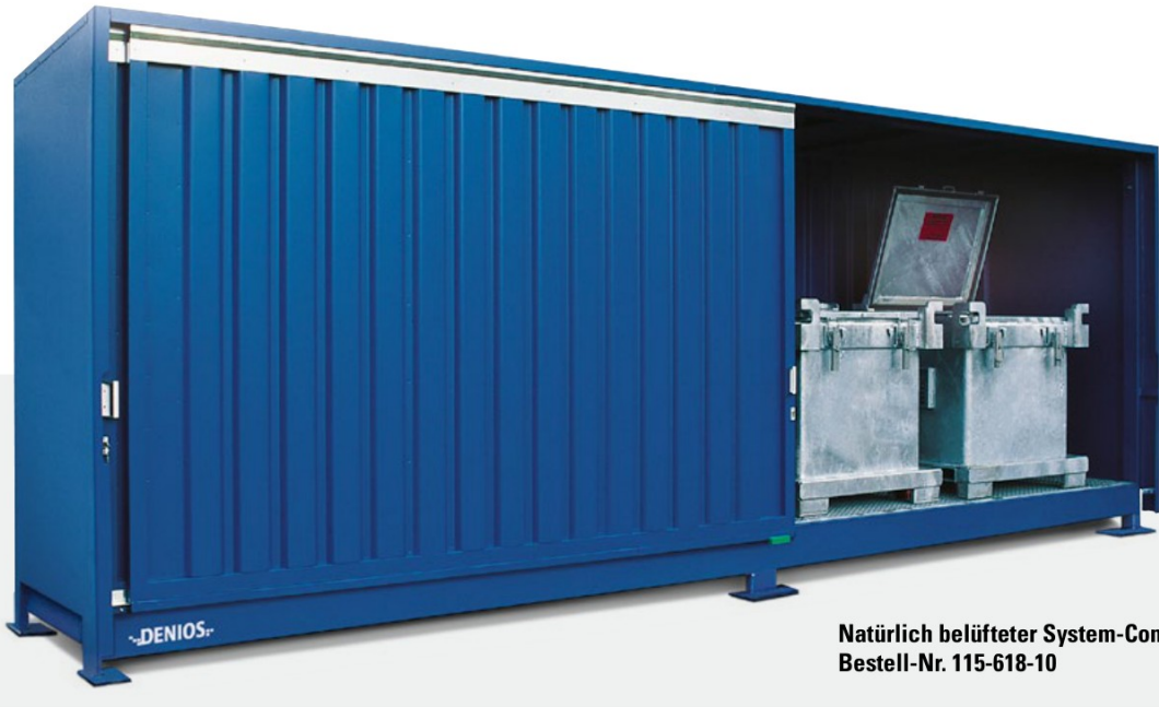
Natürlich belüfteter System-Container 1K 714.0 mit Schiebetoren, Bestell-Nr. 115-618-10

i Alle System-Container in offener Version oder mit Flügel- / Schiebetoren eignen sich durch den Einsatz unseres Erdungs-Sets hervorragend für die Lagerung entzündbarer Flüssigkeiten (H224-226).