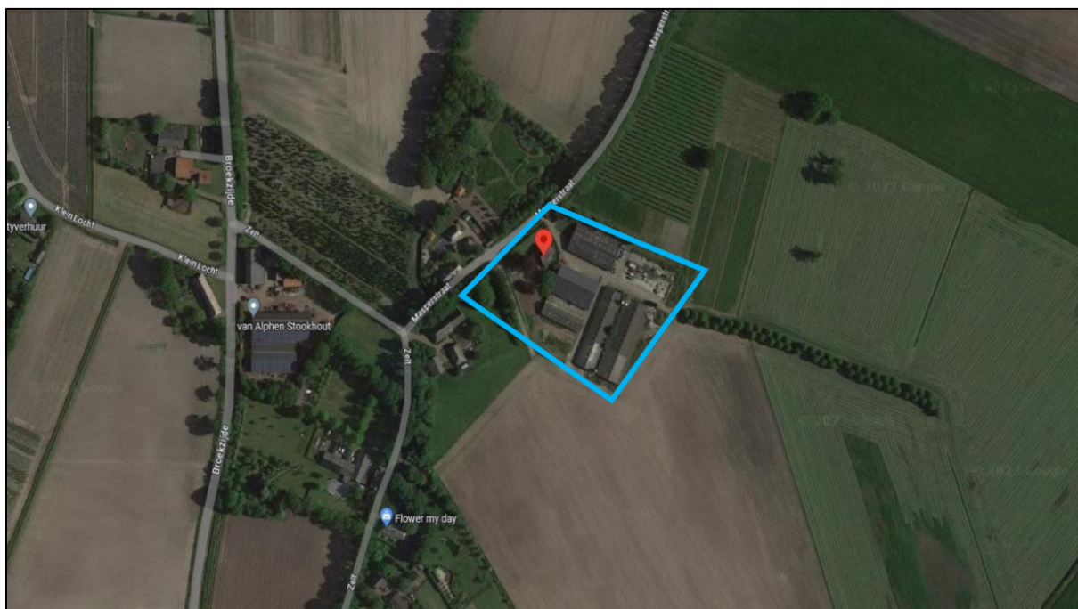
Figuur 1. Locatie Masperstraat 2 te Moergestel. De activiteiten vinden plaats binnen het omliggende gebied.