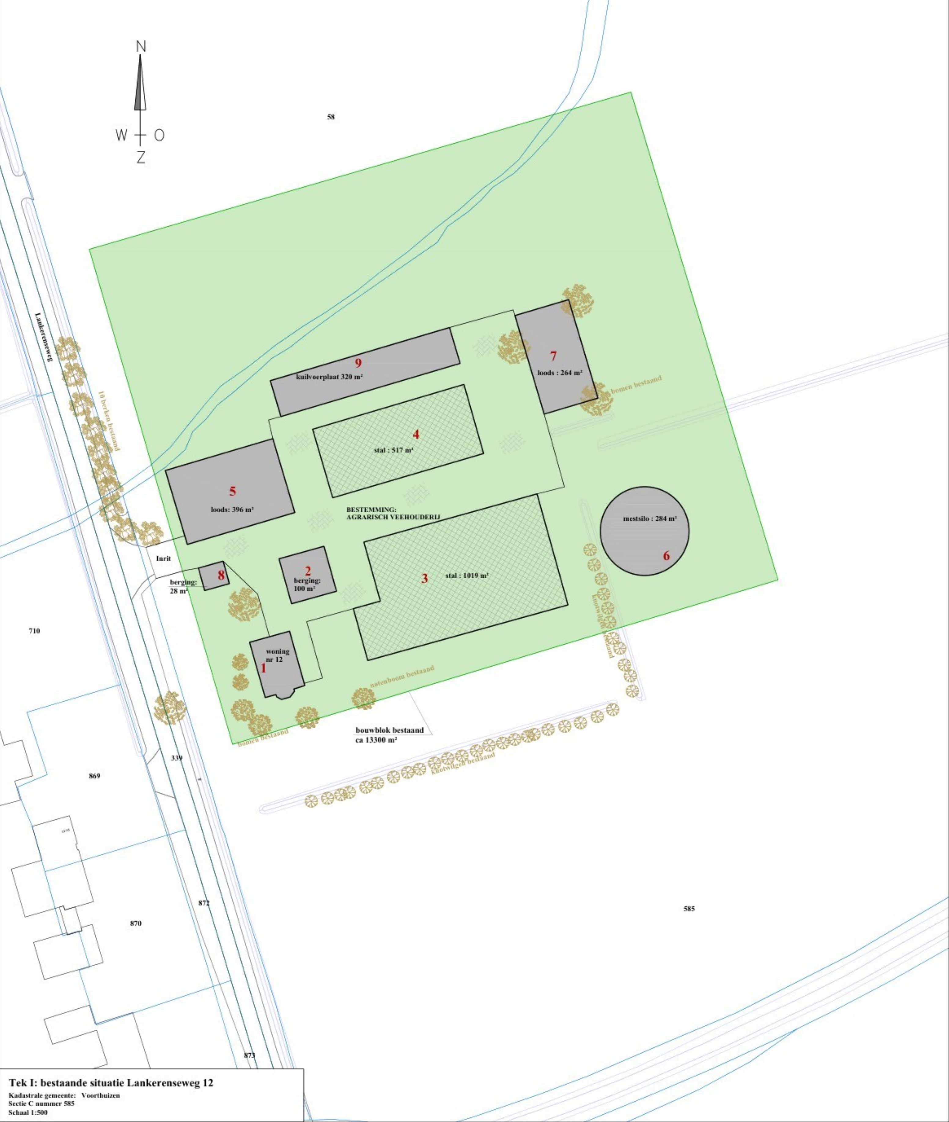
Tek I: bestaande situatie Lankerenseweg 12 Kadastrale gemeente: Voorthuizen Sectie C nummer 585 Schaal 1:500