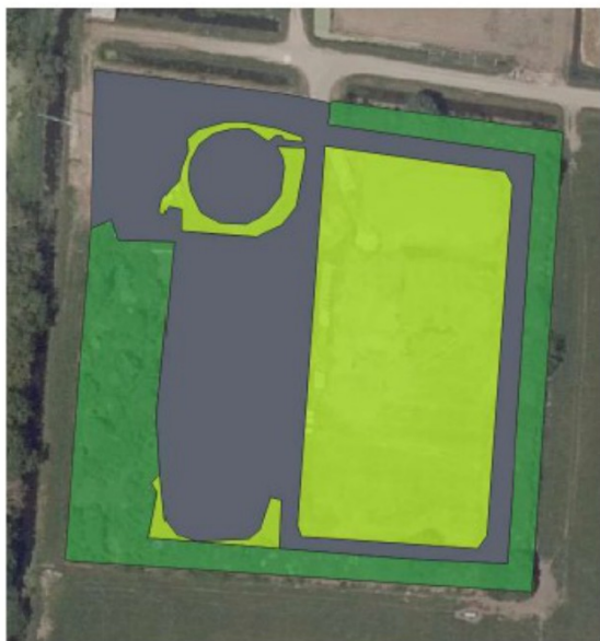
Figuur 5. Schematische weergave van de oude situatie. De lichtgroene onderdelen betreffen gras en braakliggende grond, de donkergroene onderdelen betreffen bosschages en de grijze onderdelen betreffen verharding.