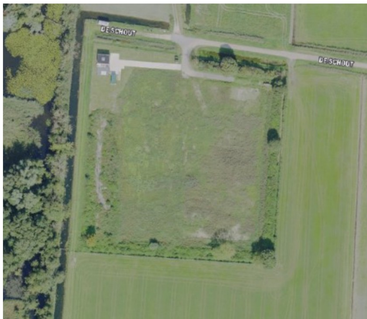
Figuur 2. Luchtfoto van het plangebied na verwijdering bebouwing, verhardingen en bosschage (Foto 2023).