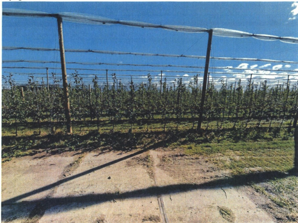
Bijlage 1: Foto's

rechtbank Gelderland cluster bestuursrecht