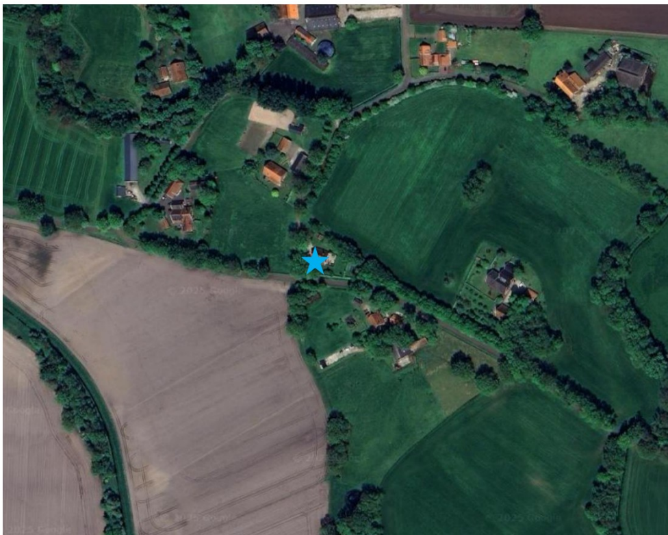
Figuur 4: Directe omgeving geplaatste steenuilenkast op de Boeijinkweg 7.