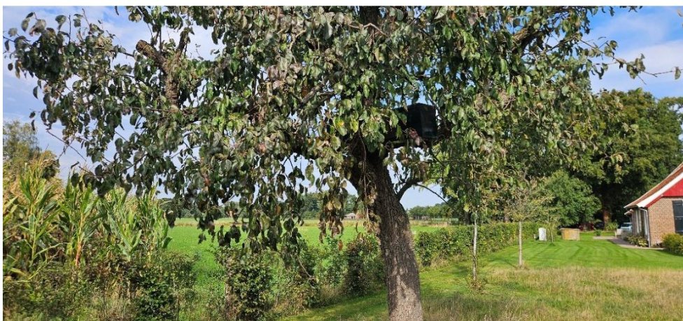
Figuur 6: Geplaatste steenuilenkast in een fruitboom op de Boldermansweg 4.

Door de plaatsing van de steenuilenkast is er een nieuw geschikt leefgebied ontstaan voor de steenuil wat voldoet aan de basisbehoefte van de steenuil: voortplanting, voedsel, veiligheid en verbinding met de omgeving.