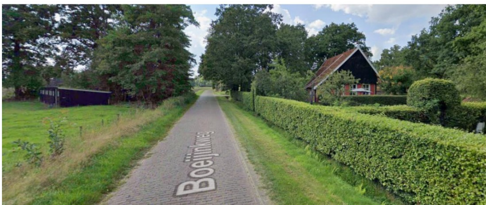
Figuur 5: Beeld Google Street View van de Boeijinkweg 7