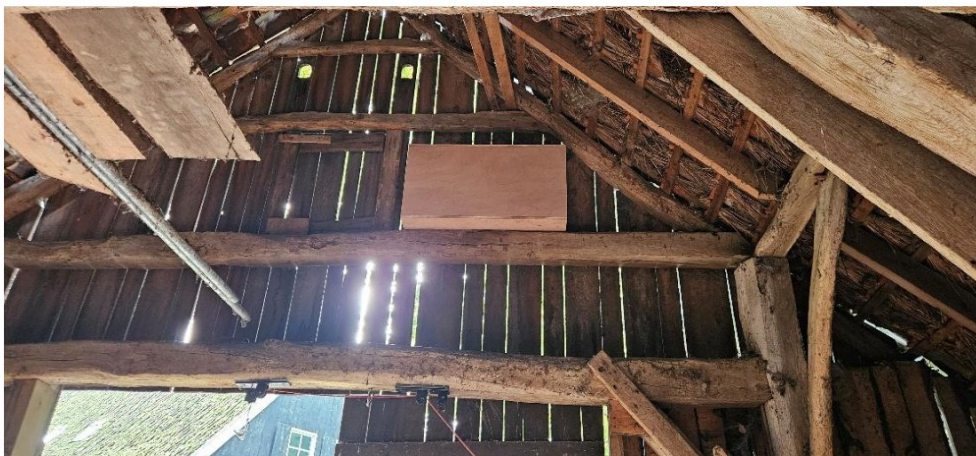
Figuur 3: Geplaatste steenuilenkast van binnen gezien op de Boeijinkweg 7.

Tijdens de plaatsing is er ook op gelet of de omgeving voldoende voedsel en schuilmogelijkheden biedt om een compleet leefgebied te vormen voor de steenuil. Op Figuur 4 is een luchtfoto van de directe omgeving van het de nestkast opgenomen. Hieruit blijkt dat het gaat om een coulisselandschap met voldoende bomen in de omgeving die als schuilplaats kunnen dienen. Het was daarom niet nodig extra bomen aan te planten. Figuur 5 laat een beeld vanuit Google Street View zien. Het coulisselandschap bestaat verder uit hagen, greppels en zowel lang als kort gras. Dit biedt voldoende voedselaanbod voor de steenuil. Al met al is dit een perfecte omgeving voor de steenuil, alleen miste een geschikte broedlocatie. Door deze aan te bieden is er de ruimte ontstaan voor een volledig territorium.