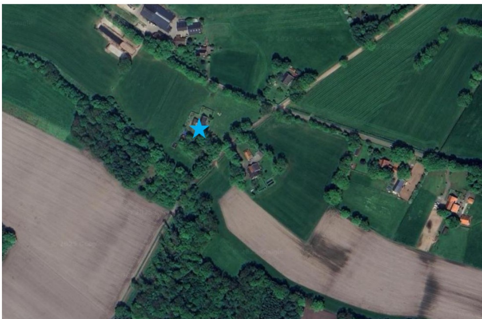
Figuur 10: Directe omgeving geplaatste steenuilenkast op de Henxelseweg 9.