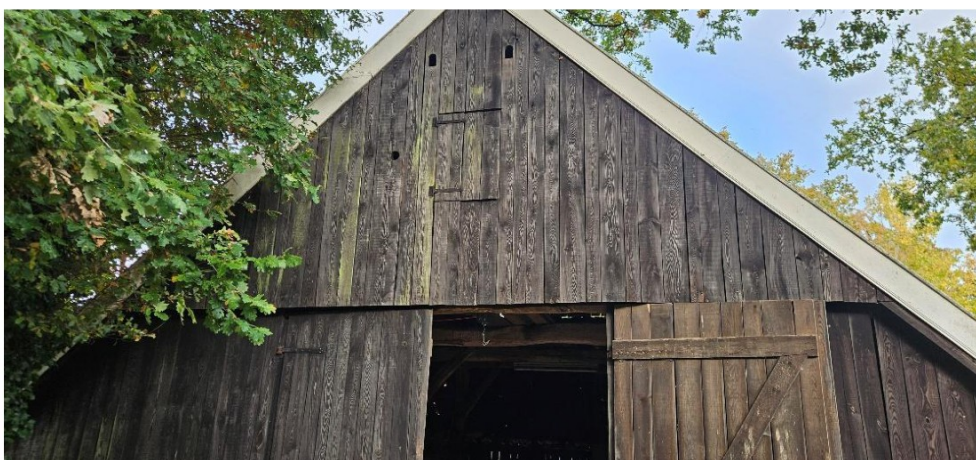
Figuur 2: Geplaatste steenuilenkast van buiten gezien op de Boeijinkweg 7.