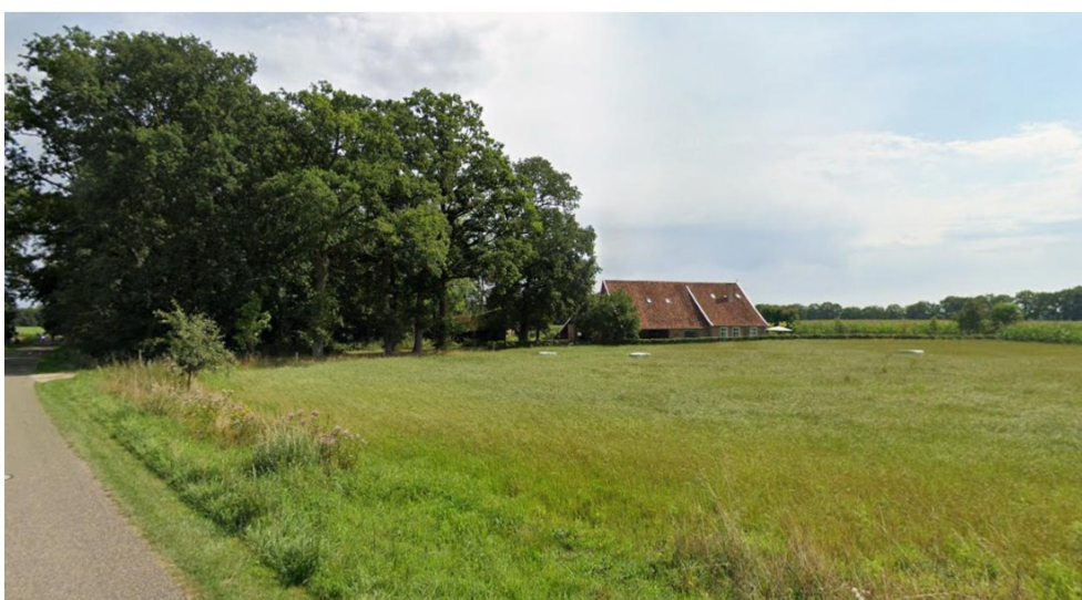
Figuur 8: Beeld Google Street View van de Boldermansweg 4