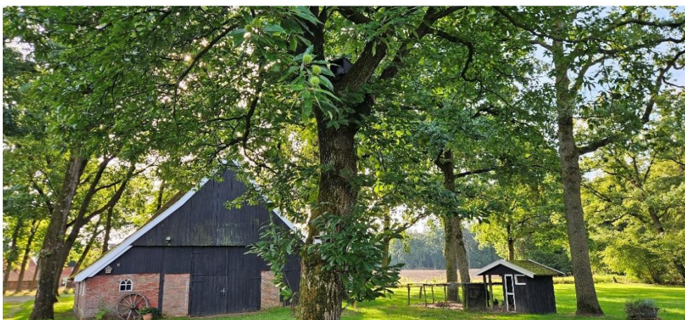
Figuur 9: Geplaatste steenuilenkast in een tamme kastanjeboom op de Henxelseweg 9.

Op de Henxelseweg 9 in buurtgemeenschap Henxel te Winterswijk is de laatste kast geplaatst. Net als op de Boldermansweg 4 betreft dit een kast die in een boom is geplaatst. De desbetreffende boom is een tamme kastanje, zie Figuur 9. Deze locatie ligt het dichtst bij het besluitgebied van de drie geplaatste kasten. Deze locatie betrof een geschikt leefgebied voor de steenuil, waar geen geschikte nestplaats meer aanwezig was. Ook op deze locatie is met het plaatsen van de kast een compleet territorium aanwezig waar alle elementen aanwezig zijn voor de basisbehoefte van de steenuil: verblijfplaatsen, veiligheid, voedsel en verbinding met andere steenuilterritoria. Er zijn reeds voldoende bomen aanwezig. Ook is er een variatie aan lagere struiken, grasland, agrarisch landschap en erven aanwezig.