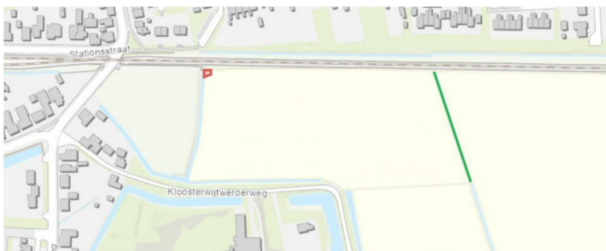
Figuur 1: Locatie van activiteiten. Het rode vlak geeft de opgevulde laagte weer. De groene lijn geeft het te vergroten oppervlaktewaterlichaam weer.

Het dagelijks bestuur van het waterschap Noorderzijlvest heeft op 9 januari 2026 van [REDACTED] een aanvraag ontvangen om een omgevingsvergunning als bedoeld in artikel 5.1, tweede lid, van de Omgevingswet (Ow). De aanvraag betreft het hebben opgevuld van een laagte bij een watergang en het vergroten van een oppervlaktewaterlichaam nabij Kloosterwijdwerderweg 6 te Usquert, zoals hieronder globaal is weergegeven in figuur 1.