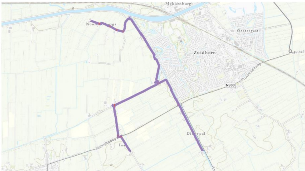
Figuur 1: de paarse lijnen geven globaal de tracés aan van het te leggen glasvezelnetwerk.

Het dagelijks bestuur van het waterschap Noorderzijlvest heeft op 3 december 2025 van [REDACTED] een aanvraag ontvangen om een omgevingsvergunning als bedoeld in artikel 5.1, tweede lid, van de Omgevingswet (Ow). De aanvraag betreft het aanleggen van het glasvezelnetwerk nabij Niekerkerdiep Zuidzijde 4 te Brilt, zoals hieronder globaal is weergegeven in figuur 1.