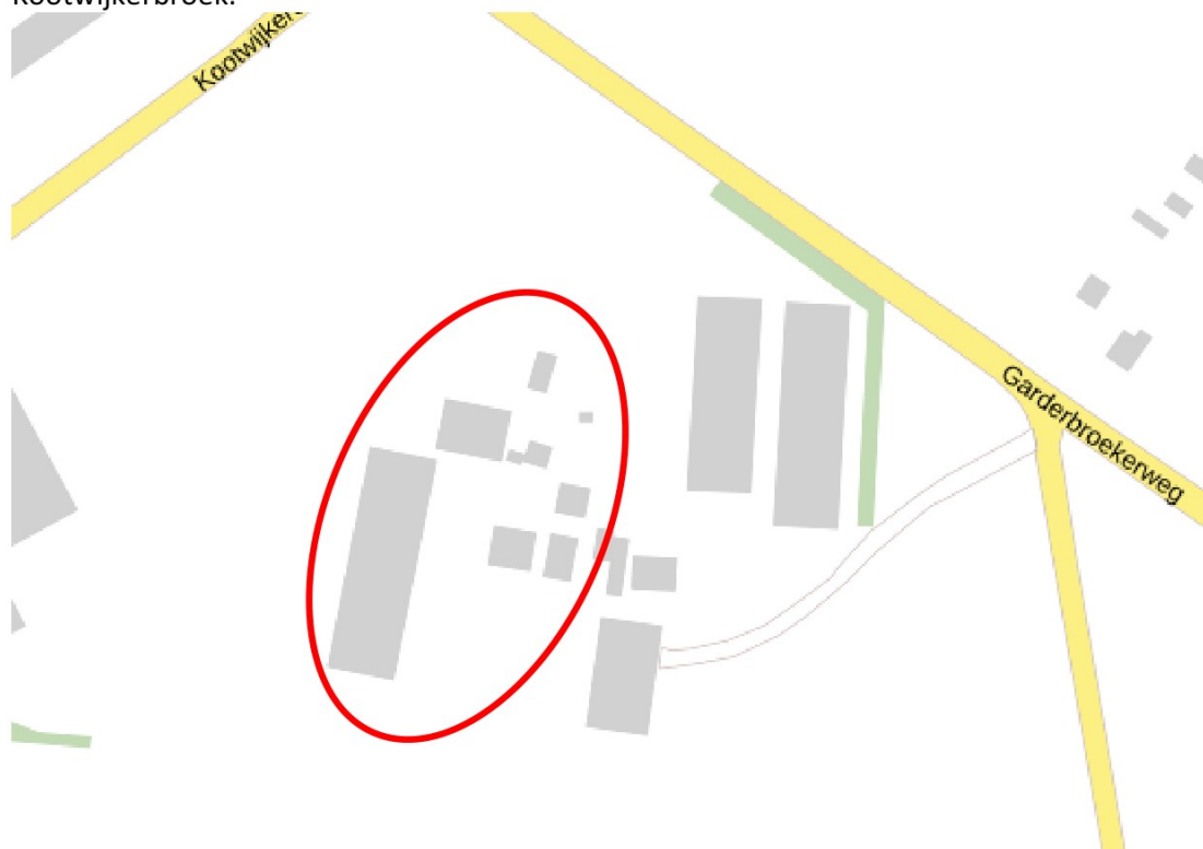
Figuur 1 Ligging van locatie.

De ontwikkellocatie ligt in de gemeente Barneveld aan Garderbroekerweg 196-198 in Kootwijkerbroek.