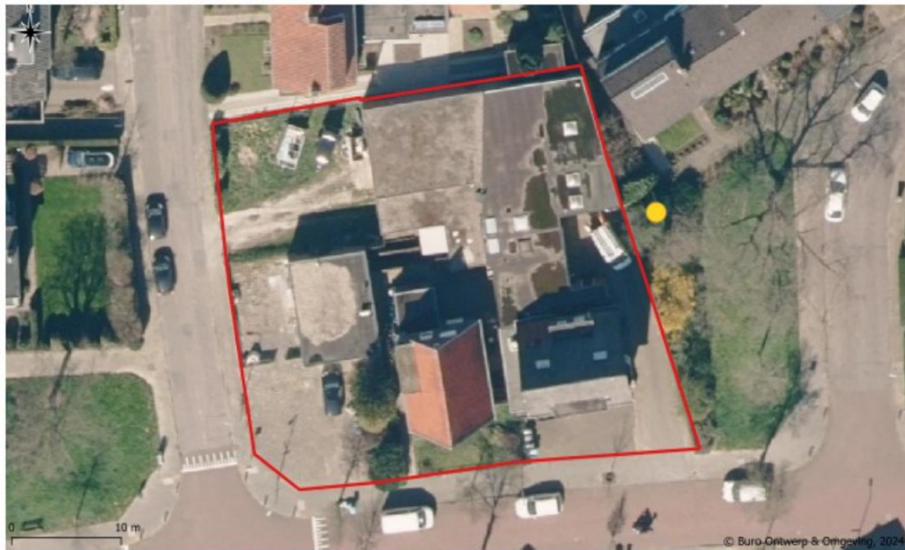
Figuur 10: Locatie eerste steenmarterkast ten oosten van het plangebied (gele stip).