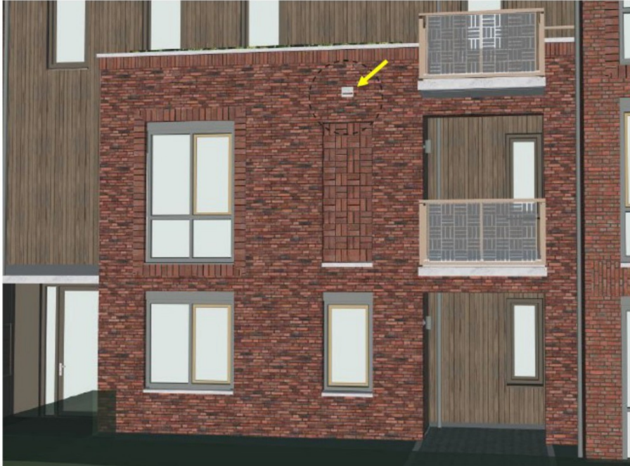
Figuur 4: Permanente voorziening gewone dwergvleermuis in de zuidgevel van de nieuwbouw.