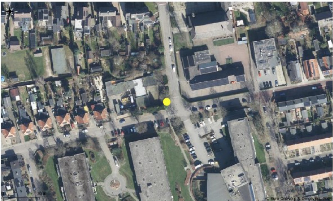
Figuur 11: Locatie tweede steenmarterkast op de hoek van de Mauritiussstraat en Worth-Rhedenseweg in Rheden (gele stip), circa 250 meter vanaf het plangebied.