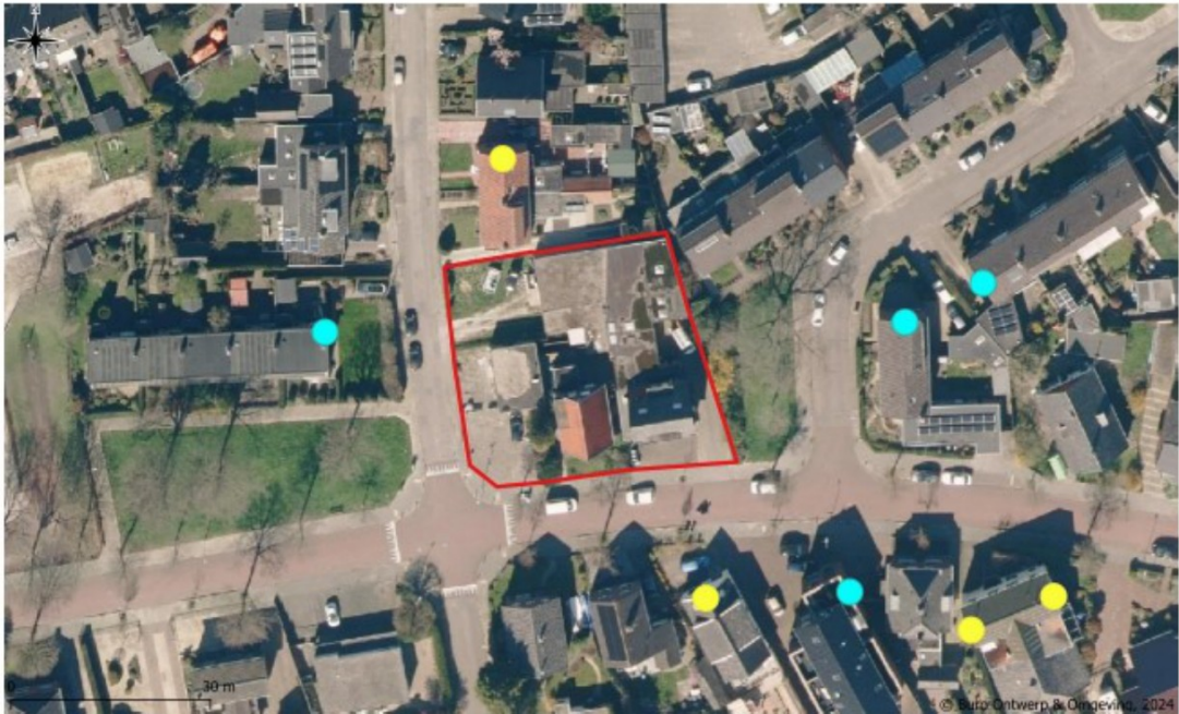
Figuur 3: Locaties van de tijdelijke alternatieve voorzieningen voor gewone dwergvleermuis (gele stippen) en gewone grootoorvleermuis (blauwe stippen).