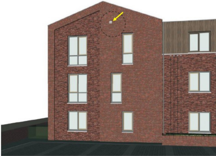
Figuur 6: Permanente voorziening gewone dwergvleermuis in de noordgevel van de nieuwbouw.