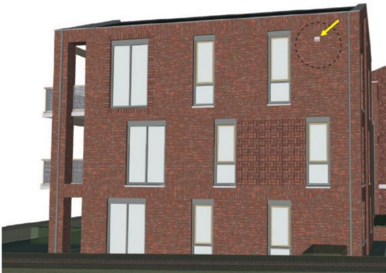
Figuur 5: Permanente voorziening gewone dwergvleermuis in één van de oostgevels van de nieuwbouw.