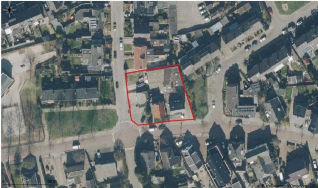
Figuur 1: Overzicht van het plangebied (rood omkaderd) aan de Arnhemseweg 26-28a in Rheden.