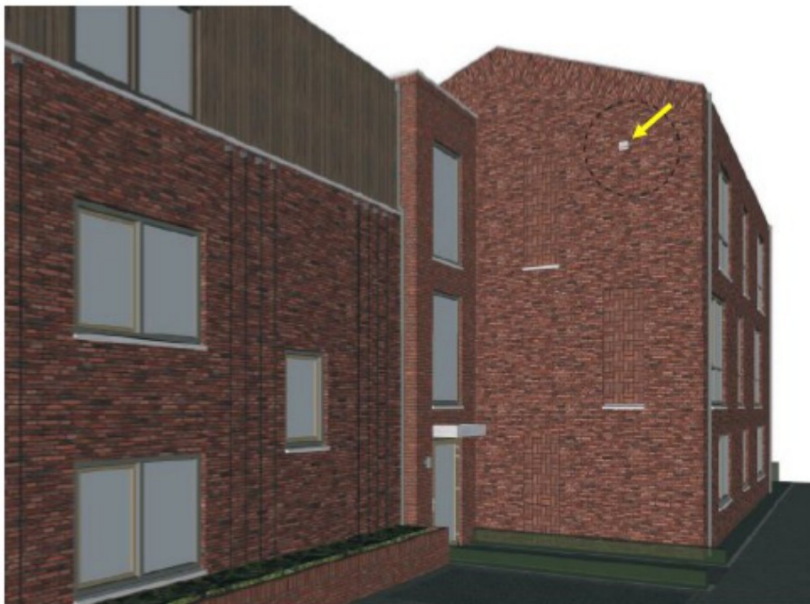
Figuur 7: Permanente voorziening gewone dwergvleermuis in één van de oostgevels van de nieuwbouw.