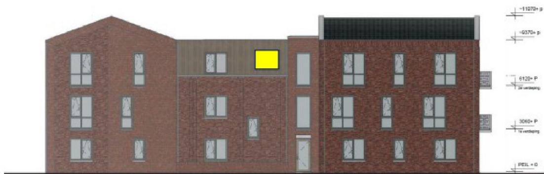
Figuur 8: Permanente voorziening gewone grootoorleermuis in de noordgevel van de nieuwbouw.