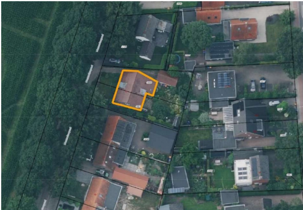
Figuur 2: Situering van de plangebieden binnen het perceel. Het plangebied is in het oranje omlijnd.