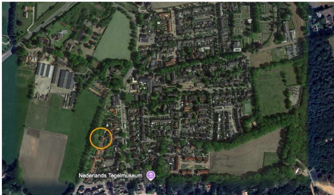
Figuur 1: Situering van het plangebied ten opzichte van Otterlo. De ligging van het plangebied is in het oranje omcirkeld.