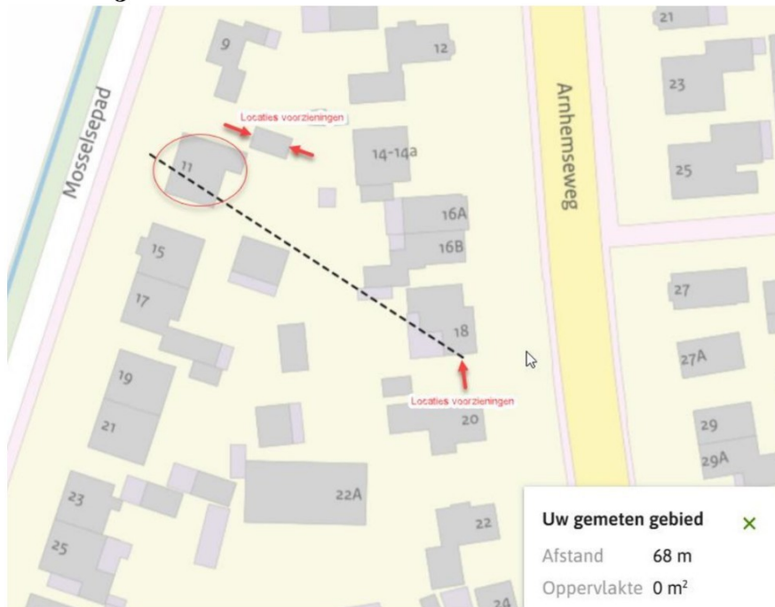
Figuur 3: Overzicht van de locaties van alle tijdelijke vleermuiskasten. De twee bovenste pijlen zijn de vleermuiskasten op de garage en de onderste pijl zijn de twee vleermuiskasten op de zuidgevel aan de Arnhemseweg 18 te Otterlo.