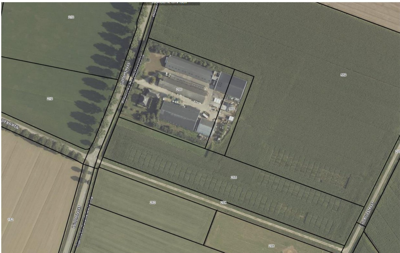
Figuur 1: Luchtfoto huidige situatie

De activiteit is opgenomen op de D-lijst (categorie D 14), en valt boven de drempelwaarde waarvoor een m.e.r.-beoordelingsplicht geldt. Omdat belangrijke nadelige milieugevolgen niet op voorhand kunnen worden uitgesloten, is een aanmeldingsnotitie m.e.r.-beoordeling vereist.