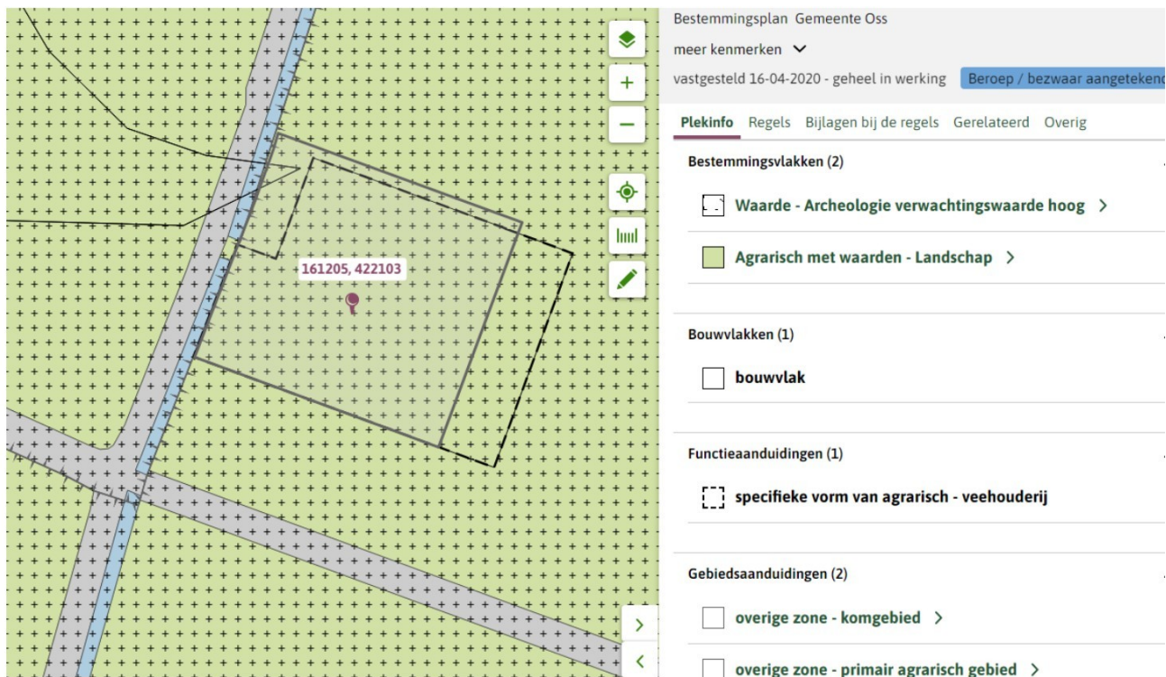
Figuur 3: Uitsnede verbeelding bestemmingsplan "Buitengebied gemeente"

Initiatiefnemer is voornemens de inrichting voor het houden van zeugen en gespeende biggen te wijzigen. Bestaande zeugenstal wordt omgezet naar vleesvarkens. De ontwikkeling vindt volledig plaats binnen de bestaande gebouwen en dus binnen het bouwvlak. Geconcludeerd wordt dat het planvoornemen passend is binnen het vigerend gemeentelijk beleid.