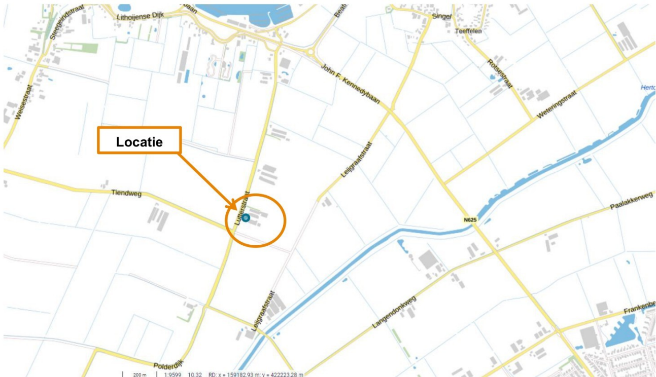
Figuur 2: Uitsnede topografische kaart met aanduiding locatie Lutterstraat 8 Lithoijen

Topografische kaart van de locatie invoegen