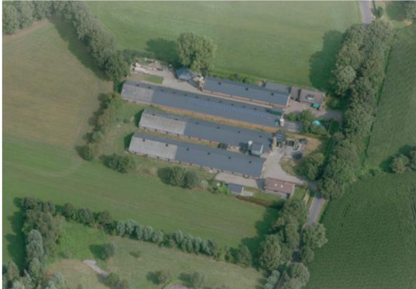
Figuur 1. Bestaande situatie Meulunterseweg 3-5

Zie onderstaand figuren 1 en 2 met de bestaande en nieuwe situatie.