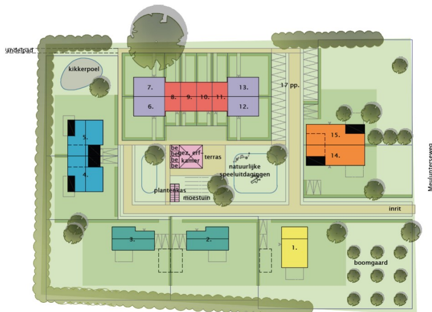
Figuur 2. Nieuwe situatie