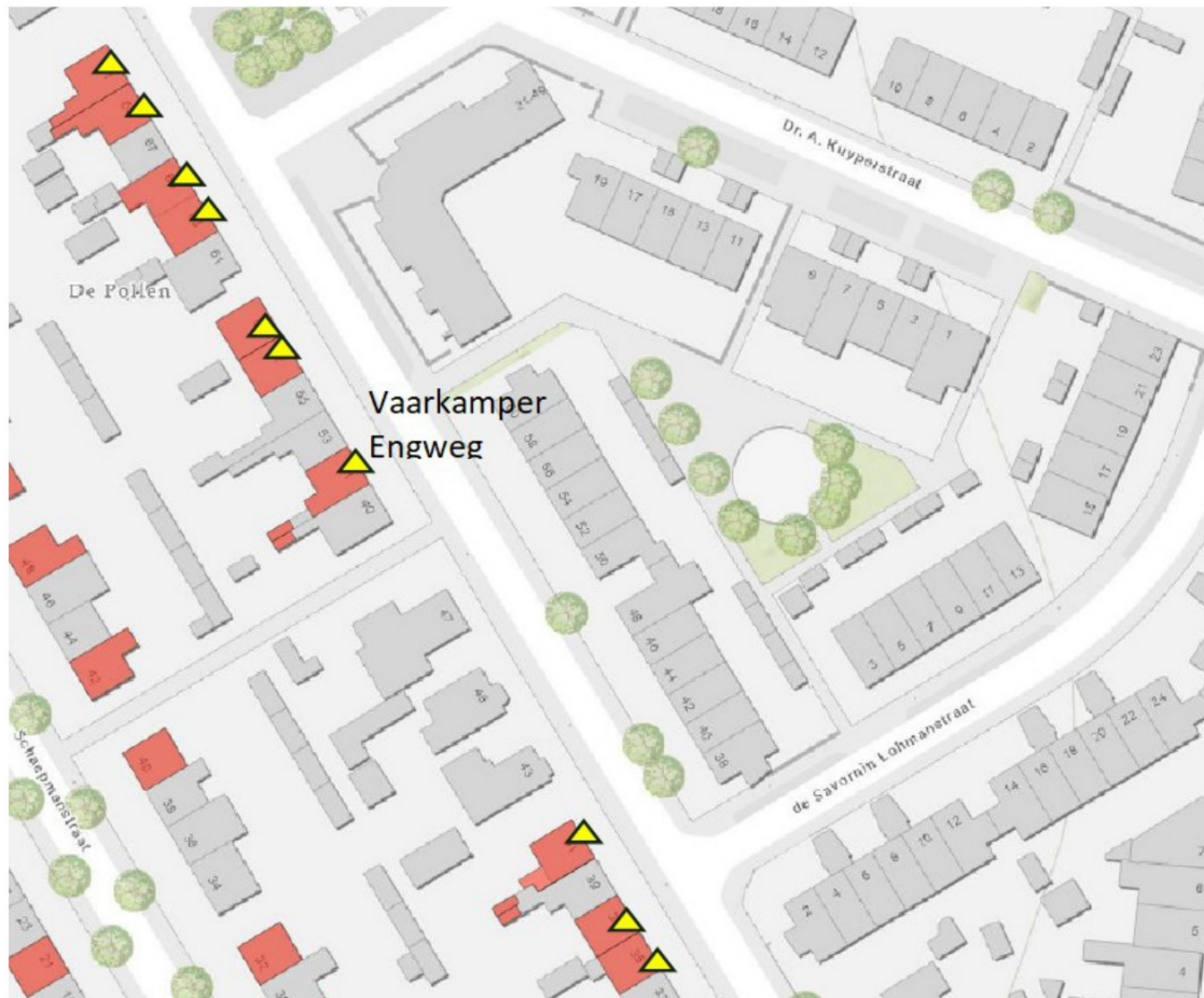
Figuur 4. Overzicht van de locaties van (een deel van) de permanente voorzieningen binnen het plangebied Vaarkamper Engweg 35, 37, 41, 51, 57, 59, 63, 65, 69 en 71. Een gele pijl duidt op 1 in te bouwen huismuskast (type HMP2 van Unitura, of vergelijkbaar). In totaal worden er dus 10 inbouwkasten voor huismus gerealiseerd.

Daarnaast wordt bij aan de oostelijke dakzijde van elke woning de vogelschroot hoger op het dak geplaatst, namelijk ten minste boven de 2 e rij dakpannen (geteld van onderaf). Deze voorzieningen zijn niet weergegeven op deze afbeelding.