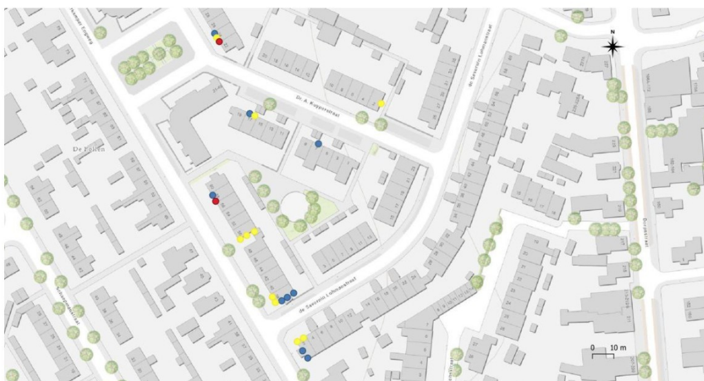
Figuur 2. Overzicht van de locaties van de tijdelijke voorzieningen in de directe omgeving van het plangebied Vaarkamper Engweg 35, 37, 41, 51, 57, 59, 63, 65, 69 en 71. Een gele stip duidt op een huismuskast; de blauwe en rode stippen zijn voor dit besluit irrelevant. In totaal moeten er 22 tweedelige kasten (HMT2 van Unitura, of vergelijkbaar) aanwezig zijn (figuur 2 en 3 gecombineerd).

De maatregelen zoals genoemd in (tabel B en) bijlage 3 van dit besluit gelden als aanvulling op (tabel 3 en) bijlage 3 van de oorspronkelijke omgevingsvergunning met zaaknummer 2023-015631.