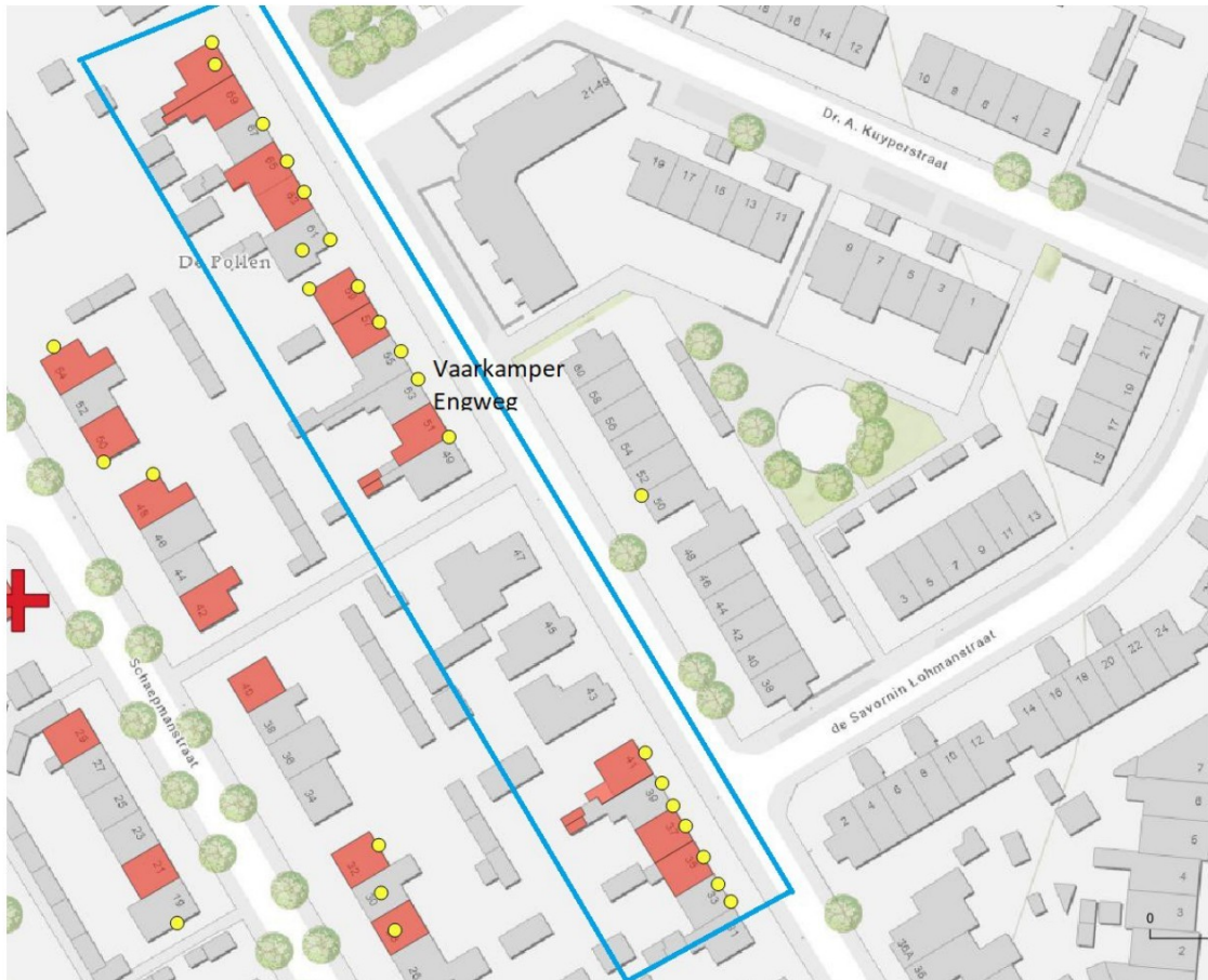
Figuur 1. Overzicht van aanwezige huismusnesten (gele stippen) in een deel van het projectgebied. De wijzigingen uit dit besluit hebben betrekking op de rood gekleurde woningen binnen het blauwe kader, Vaarkamper Engweg 35, 37, 41, 51, 57, 59, 63, 65, 69 en 71.