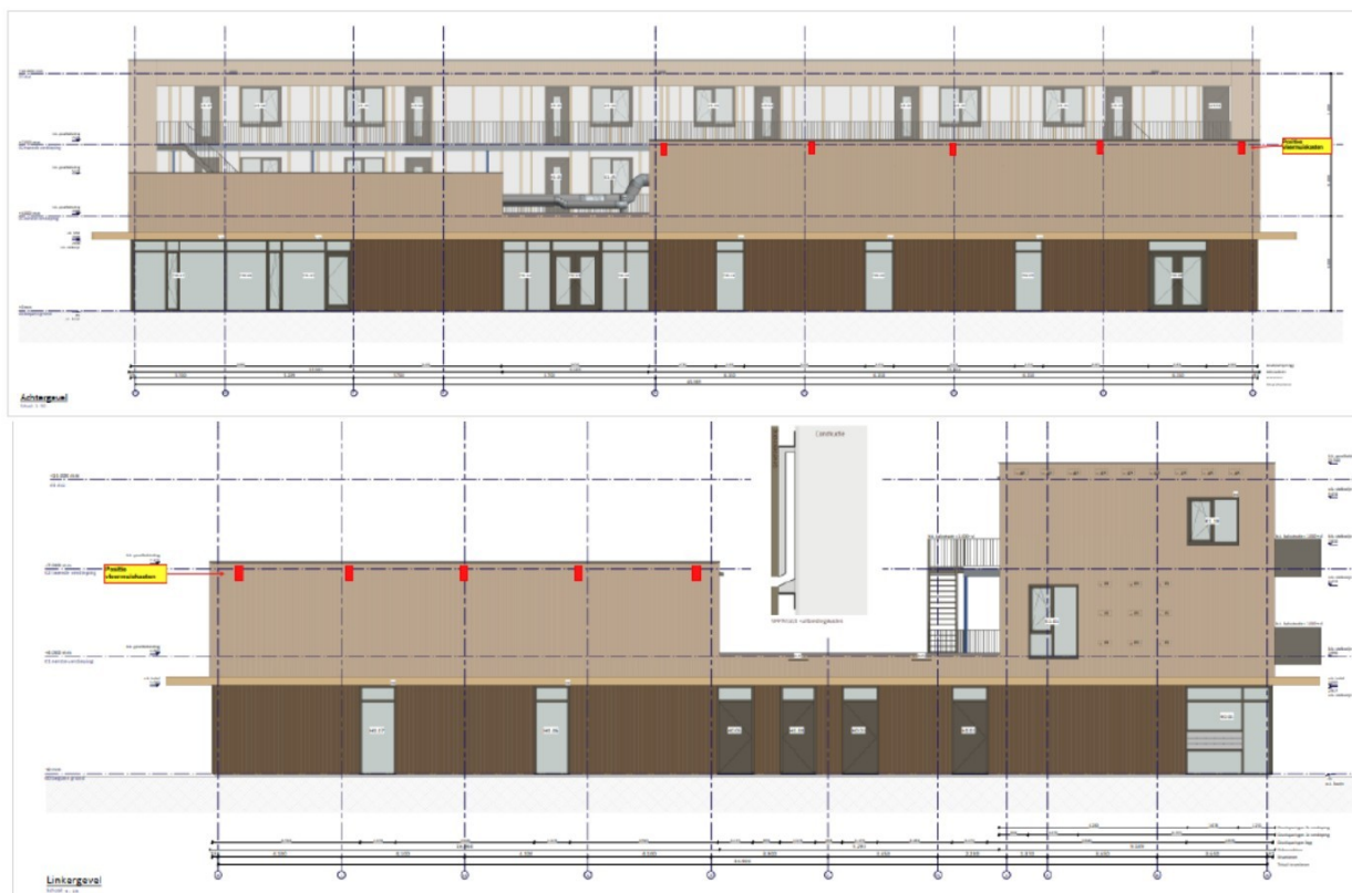
Figuur 5: Locaties van de VPM1-kasten (rode rechthoeken) op de noordelijke gevel (boven) en westelijke gevel (onder) van de nieuwbouw.

Deze constructie is alleen geschikt voor ruwe houten, gesloten gevelbekledingen. De kast moet strak aansluiten op de gevelbekleding.