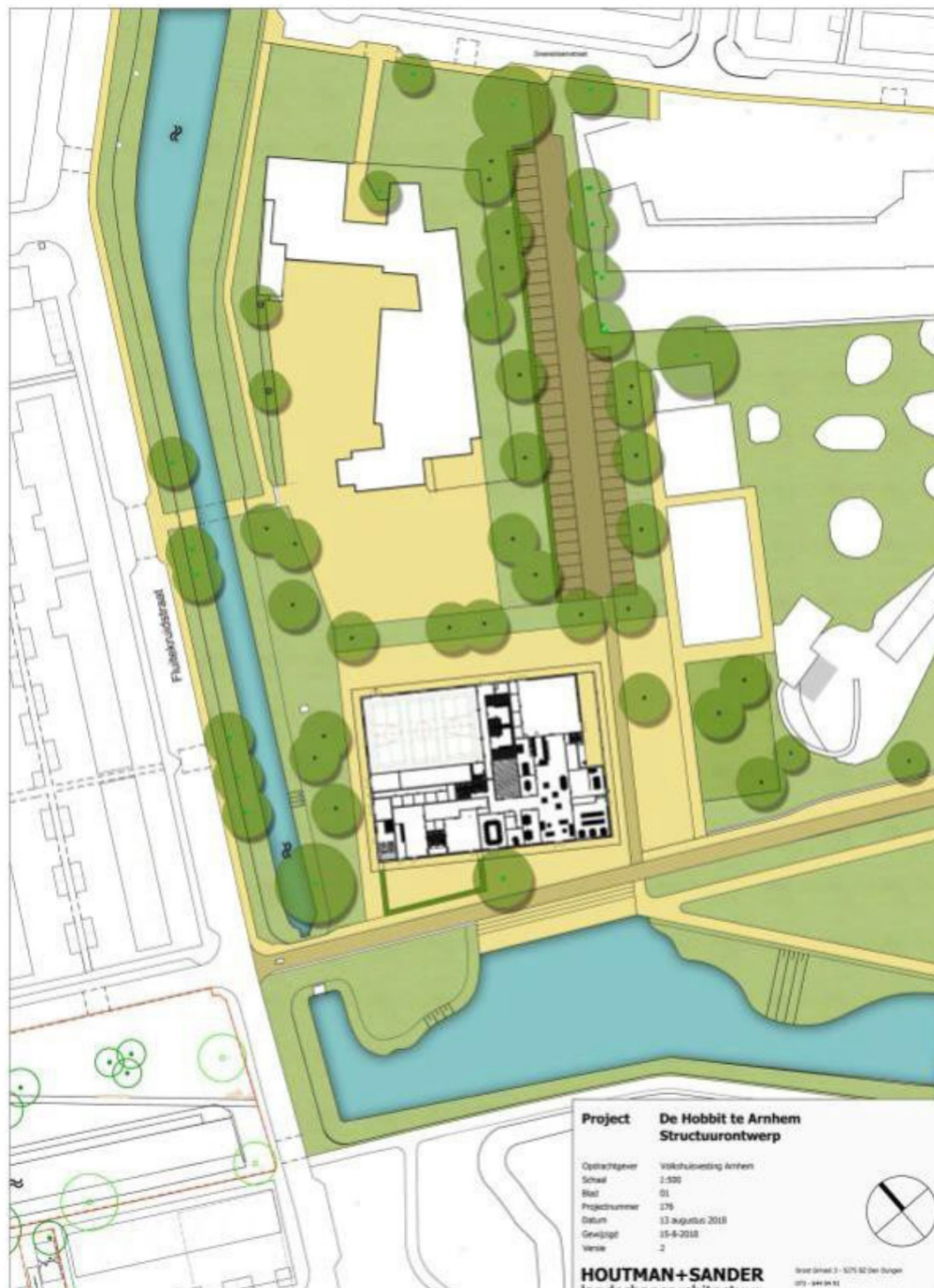
Figuur 2: Impressietekening van de toekomstige situatie.