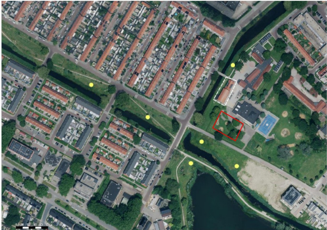
Figuur 3: locaties van de 6 geplaatste rocketbox-paalkasten voor vleermuizen (gele stippen). Het plangebied met de te slopen gymzaal is wit omlijnd. De locatie van de nieuwbouw is rood omlijnd. In deze nieuwbouw zijn in juni 2025 10 inbouwkasten gerealiseerd. Zie figuur 4 in deze bijlage voor de locatie van de inbouwkasten.