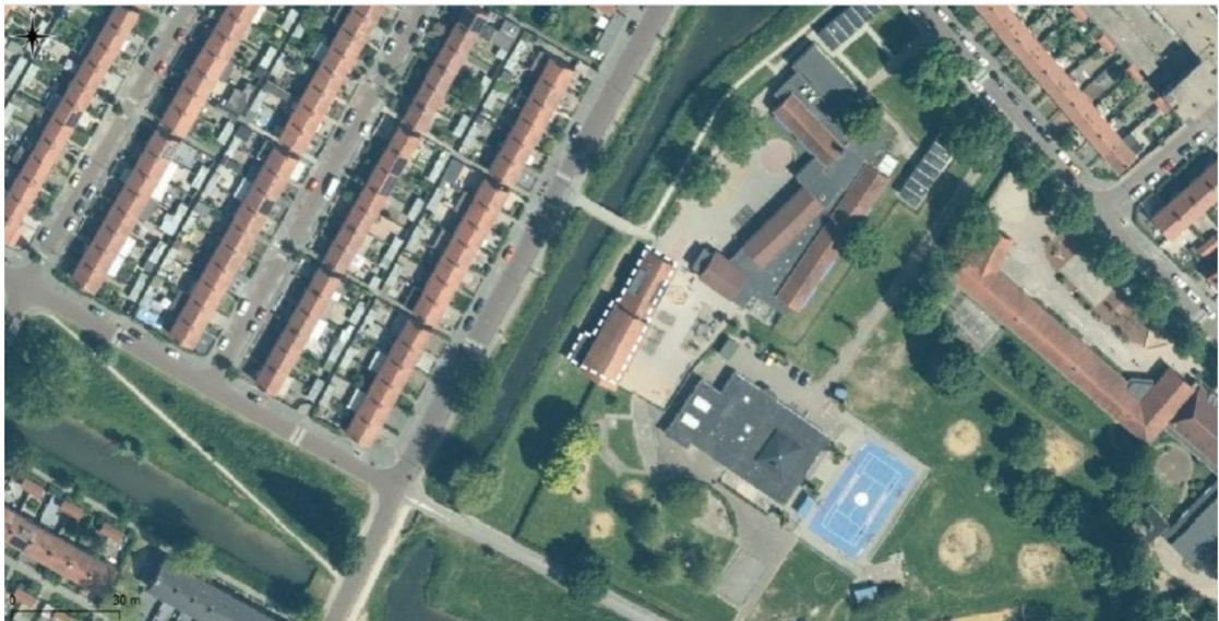
Figuur 1: Luchtfoto van het plangebied (witte stippellijn) en de directe omgeving.