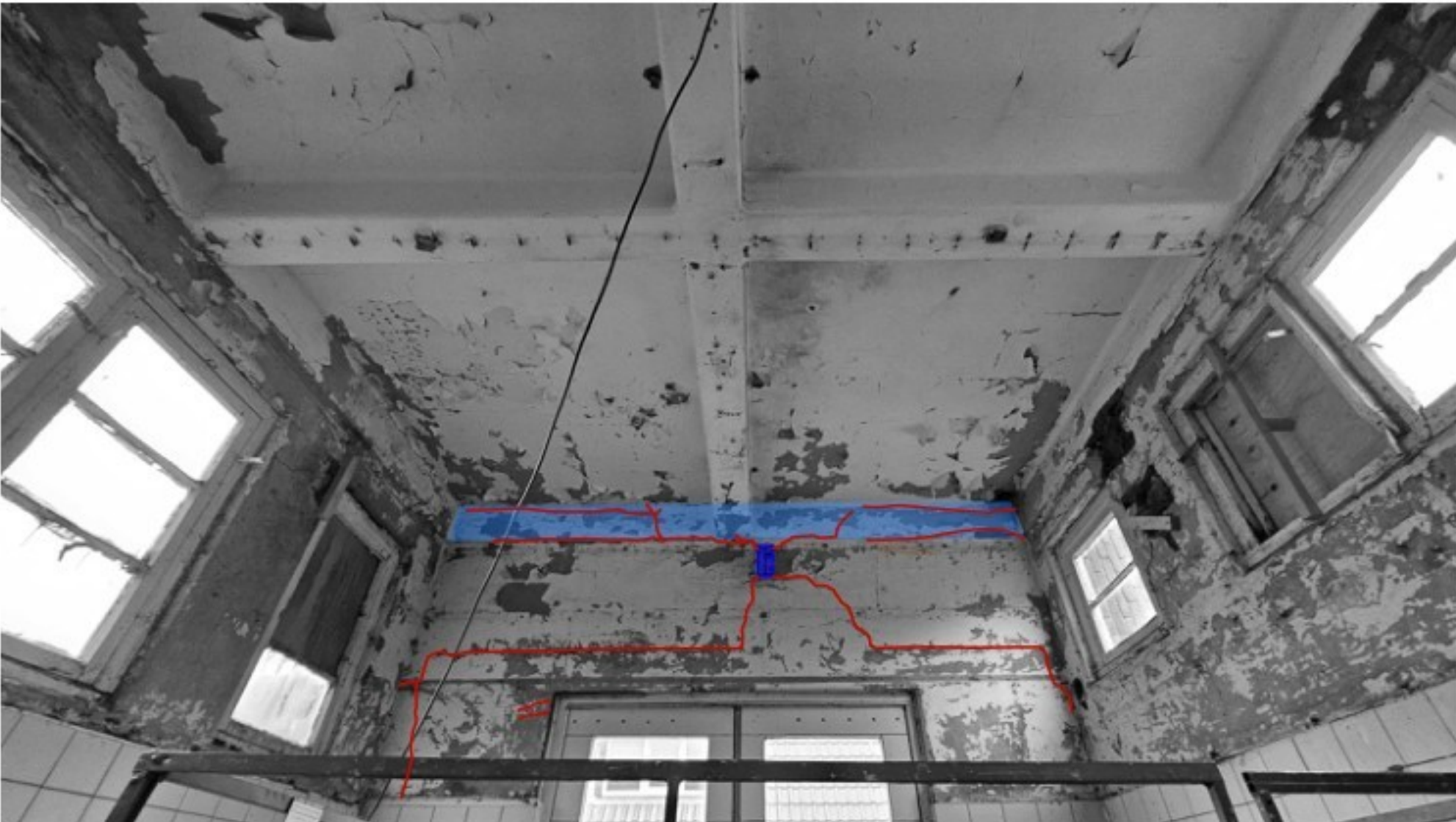
ZUIDOOST GEVEL BINNENZIJD (SLACHTHAL)