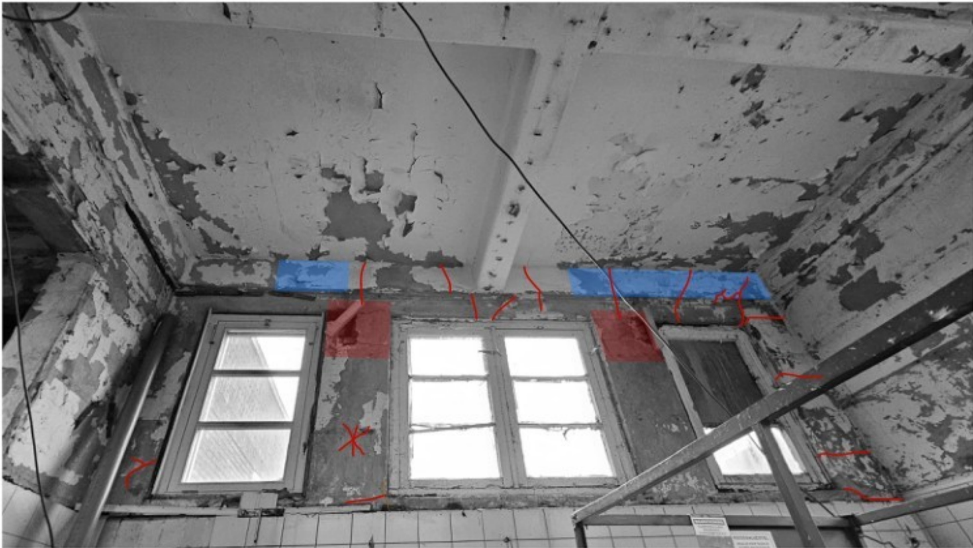
NOORDOOST GEVEL BINNENZIJD (SLACHTHAL)

LET OP!! - tekenwerk is alleen een indicatie en momentopname, schades die aangegeven zijn op tekening waren visueel zichtbaar tijdens inspectie, doordat er nog veel afbladderende verflagen aanwezig zijn op het beton- en stucwerk zijn veel scheuren niet zichtbaar - tevens is er kans dat er meer (beginnend) aangetaste wapening in het betonwerk aanwezig is, dit is alleen zichtbaar na verwijderen verflagen en geheel bekloppen/inspecteren beton- en stucwerk.