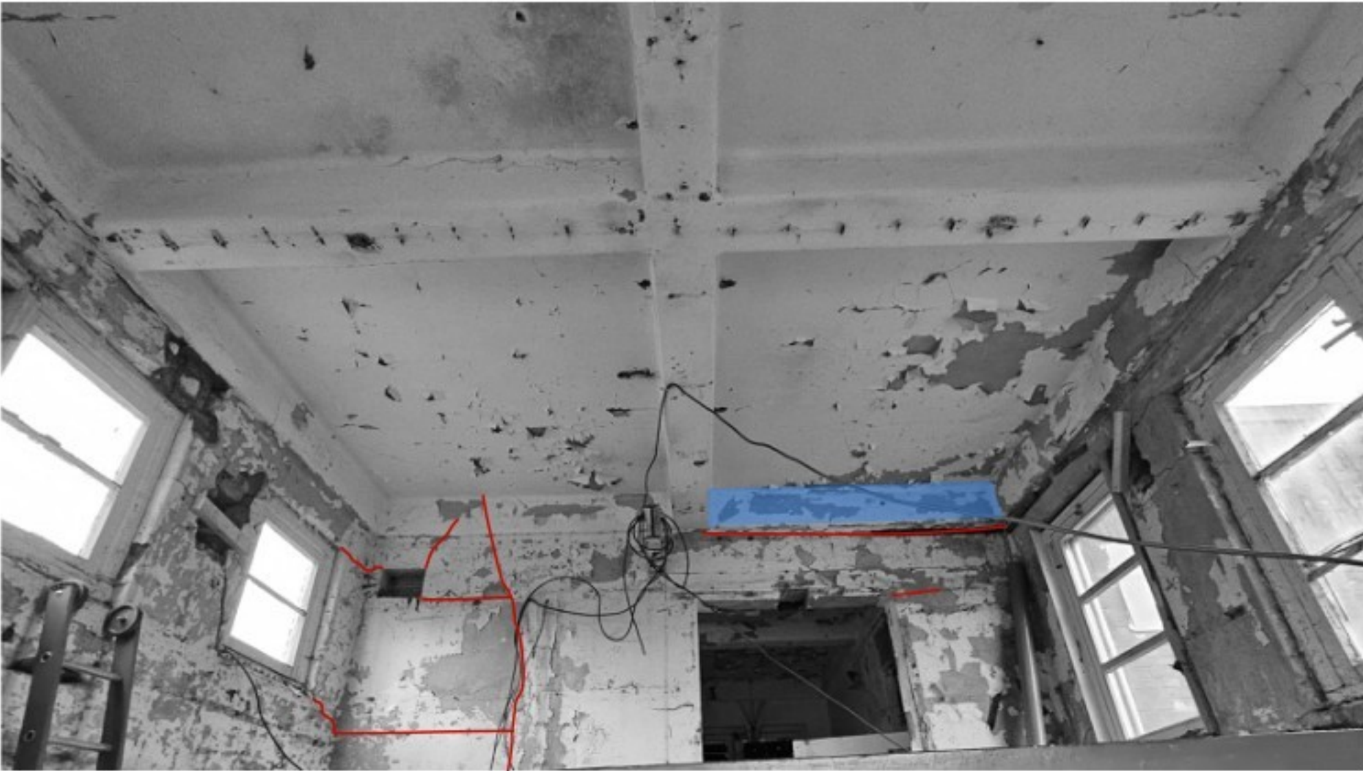
NOORDWEST GEVEL BINNENZIJD (SLACHTHAL)