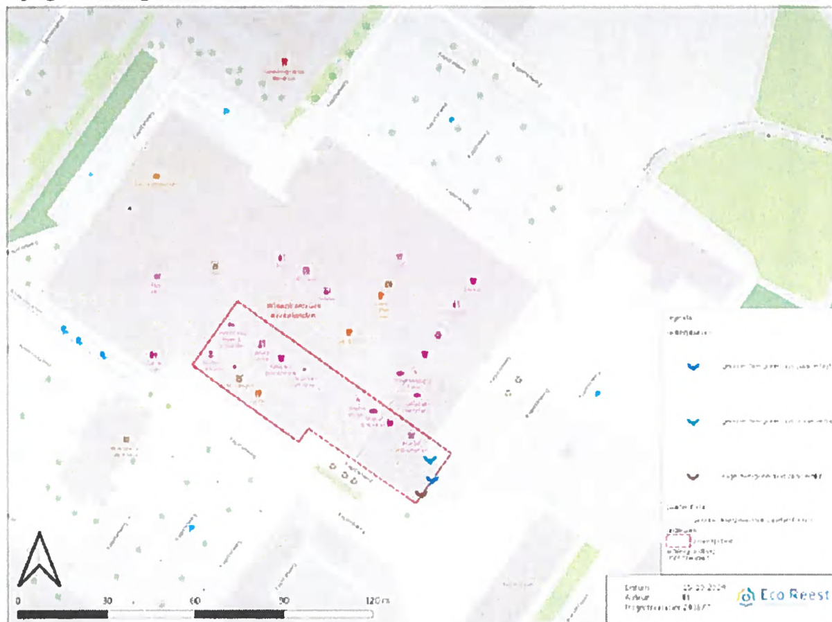
Projectgebied (rood omlijnd) en vastgestelde verblijfplaatsen vleermuizen. Aangepast vanuit activiteitenplan.