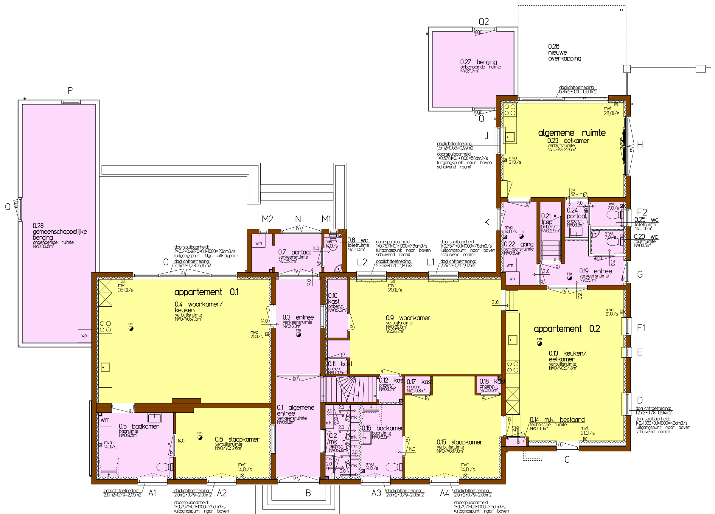
BOUWBESLUIT: BEGANE GROND