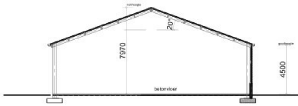
- Doorsnede B - B gebouw 4 -