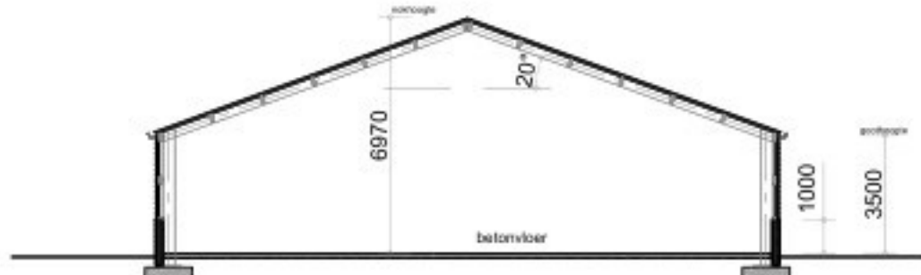
- Doorsnede A - A gebouw 3 -