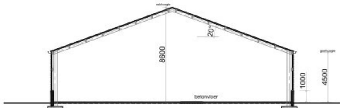
- Doorsnede C - C gebouw 5 -