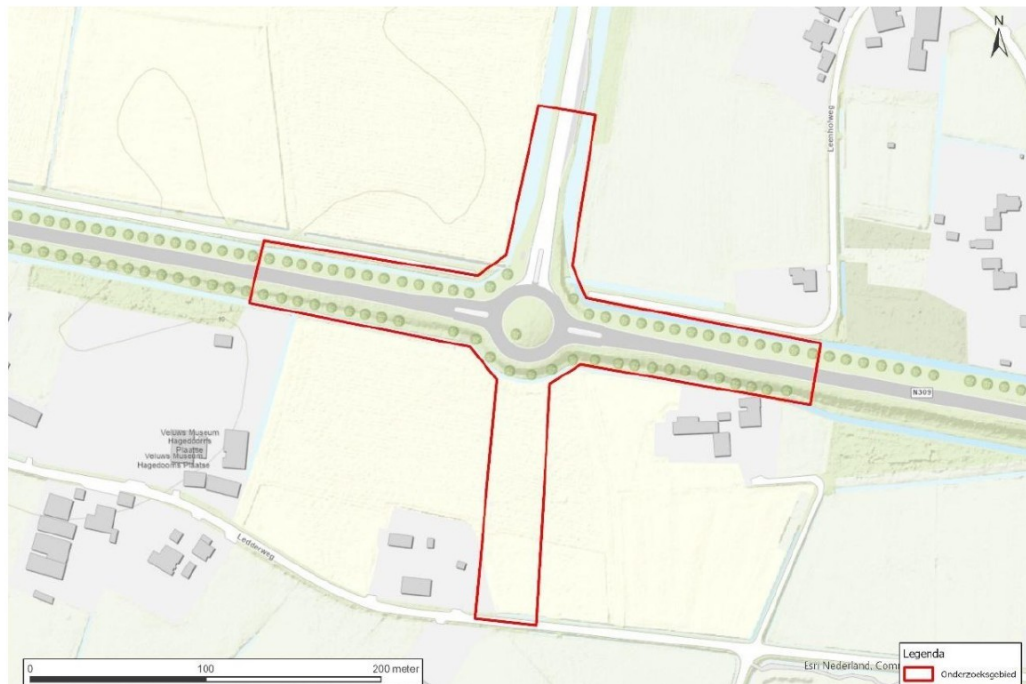
Figuur 1: Kaart van het projectgebied (rood omlijnd), rotonde De Meent aan de N309 te Epe, en omgeving.