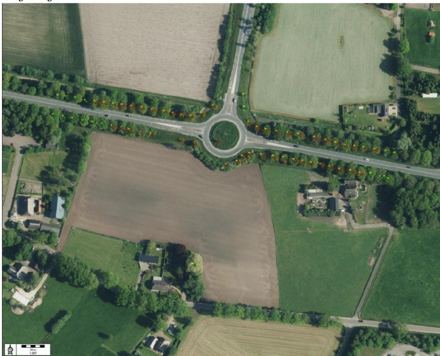
Figuur 2: Luchtfoto van het plangebied met de bomen gemarkeerd die gekapt gaan worden.