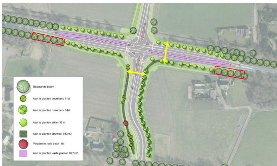
Figuur 5: Overzichtskaart van het plangebied na de werkzaamheden. De locaties van de faunaduikers zijn aangegeven met gele pijlen. De rode rechthoeken zijn de plekken van de takkenrillen waarin marterkasten worden geplaatst. In de legenda staan de groenstructuren aangegeven.