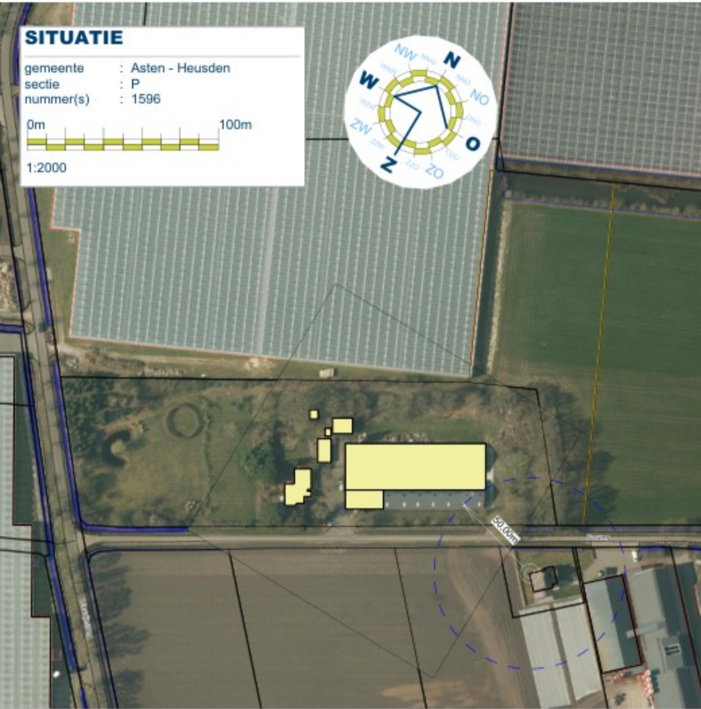
TEKENING BEHORENDE BIJ AANVRAAG OMGEVINGSVERGUNNING MILIEU BELASTENDE ACTIVITEIT (Vergunningsplichtig)