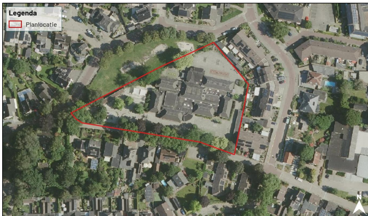
Figuur 1. Locatie aan de Melkerstraat 1 te Erp. De activiteiten vinden plaats binnen het omliggende gebied.