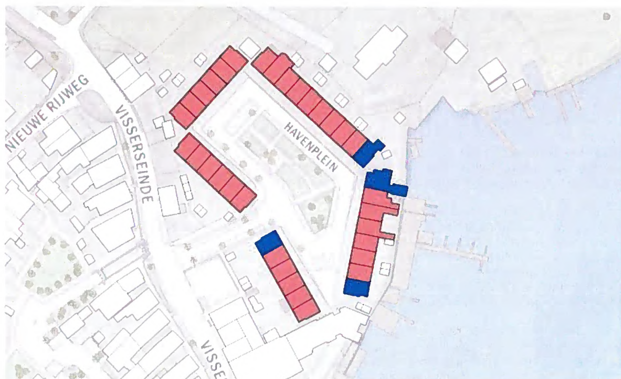
Figuur 1. Ligging van het plangebied (roze en blauwe blokken). De blauwe blokken geven de locaties weer van de locaties van de vier gevonden huismus verblijfplaatsen.