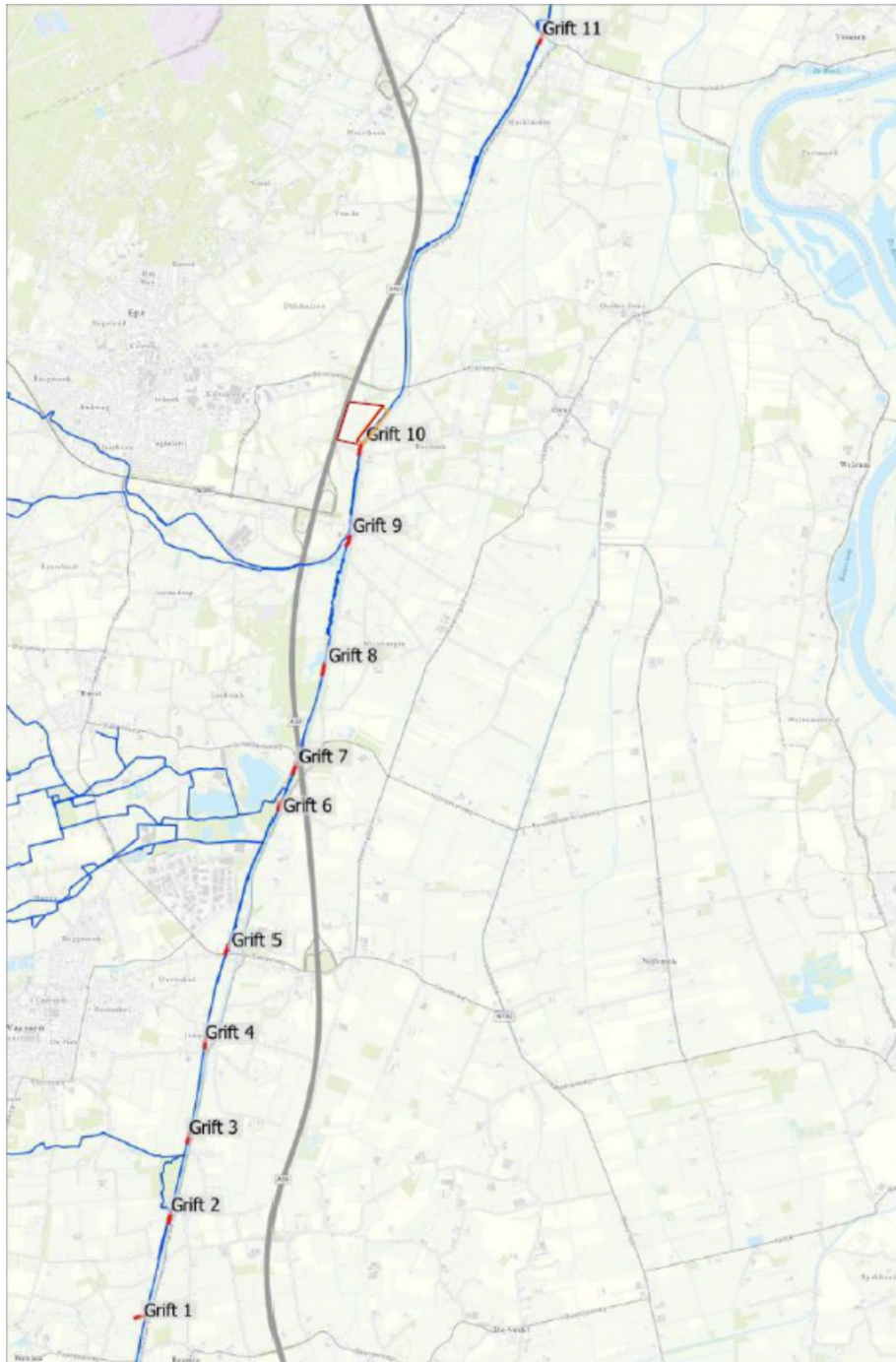
Figuur 1: Kaart van de verschillende locaties aan de Grift. Het plangebied is Grift 10.