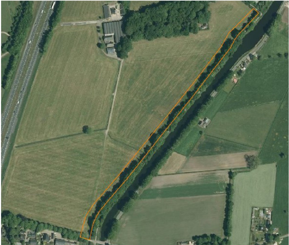
Figuur 2: Luchtfoto van het plangebied (oranje omlijnd) aan de Grift nabij Epe.