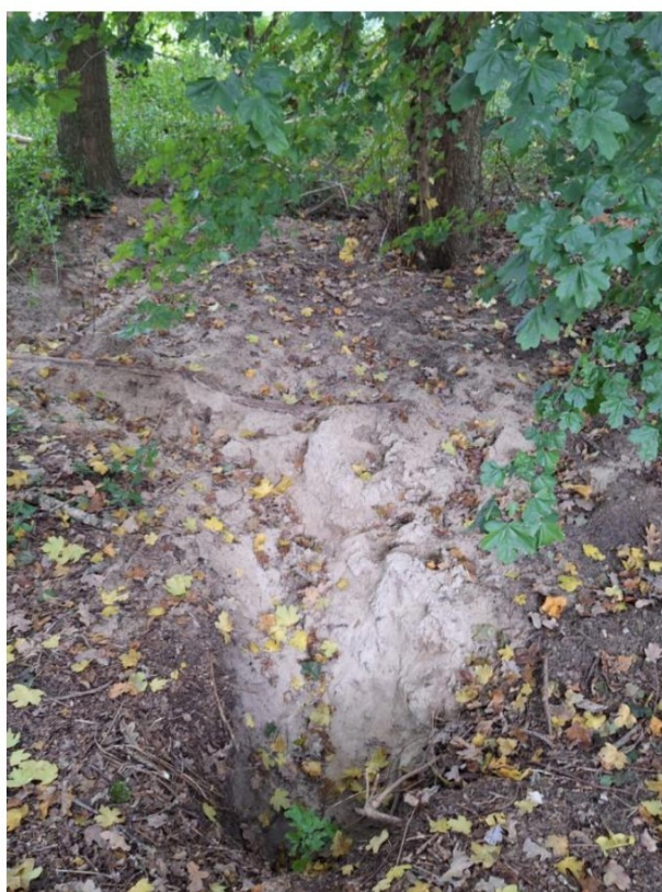
Figuur 3.2: Graafsporen bij burchtingang bij derde bezoek