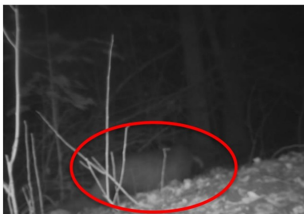
Figuur 3.5: Camerabeeld das bij burchtingang oost

Naast de das zijn ook andere soorten gezien op de camera's. Het gaat hier om vogels als een koolmees, roodborst en buizerd, een muis en een vos. Enkele van deze foto's zijn te zien in bijlage 2.