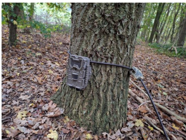
Figuur 2.1: Een geplaatste camera in het plangebied