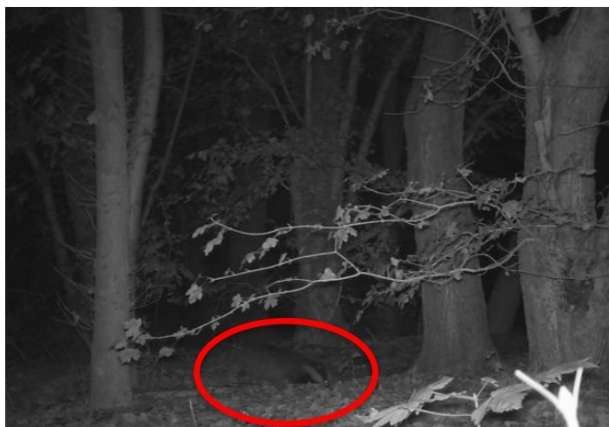
Figuur 3.4: Camerabeeld gravende das derde ronde

Bij de derde cameraplaatsing in oktober is de das wederom gefotografeerd. Hier is te zien hoe de das bij de grootste ingang in het midden van het bosschage in de vroege ochtend aan het graven is (zie figuur 3.4). Ook is de das gefotografeerd bij het betreden van een van de burchtingangen in het oosten, aan de rand van het bosschage (zie figuur 3.5).