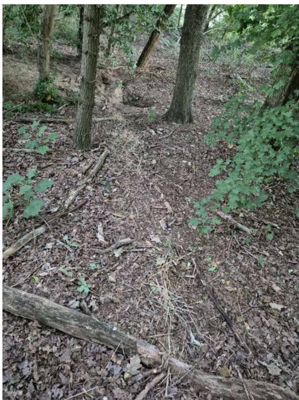
Figuur 3.1: Sleepspoor naar dassenburcht bij tweede bezoek

Bij het derde bezoek waren geen sleepsporen te zien. Hier was het echter wel te zien dat er nog graafactiviteit rond de burchten is door de lichte kleur van het zand (zie figuur 3.2). Door het natte weer waren pootafdrukken niet duidelijk te zien. Het aantal ingangen van de burcht nam gedurende het onderzoek toe van twee naar vier. Dit betekent dat de das actief bezig is om de burcht uit te breiden.