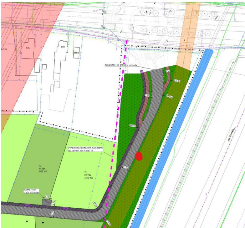
Figuur 1.1: Ontwerp van ontsluitingsweg met rotonde bovenaan, bosschage (donkergroen) met dassenburcht (rode stip), afslag door bosschage (grijze lijn) en voormalige agrarische grond (lichtgroen)

Het plangebied is gelegen aan de Deventerstraat 550 te Apeldoorn. De toekomstige rotonde en aan te leggen weg door het bosschage zijn ten noorden en westen gelegen van het aangekochte perceel waar de herontwikkeling naar een bedrijventerrein zal plaatsvinden (zie figuur 1.1 en 1.2). Het plangebied ligt tussen de A50 (oostzijde) en N344 (noordzijde) en ten westen en zuiden ligt het tegen een woonwijk, bedrijventerrein en agrarische gronden. In bijlage 1 zijn aanvullende foto's opgenomen van het gebied.