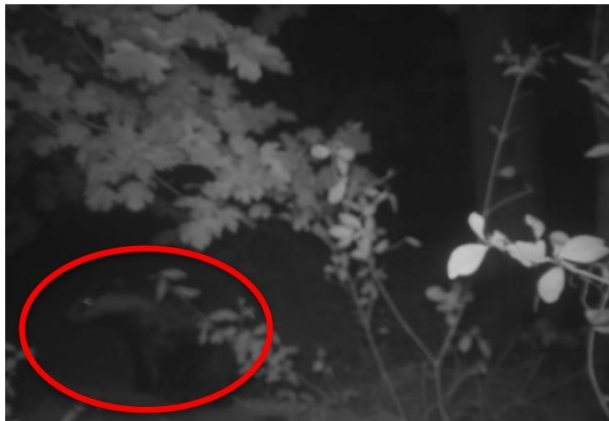
Figuur 3.3: Camerabeeld das tweede ronde

Bij de tweede cameraplaatsing in augustus is de das wel gefotografeerd. Op de foto's is de das meermaals gezien terwijl deze in de nacht de burcht verlaat en betreedt (zie figuur 3.3).