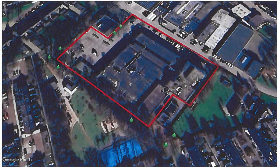
Figuur 2: Weergave van het plangebied (rood omkaderd) en de locatie van de acht tijdelijke verblijfplaatsen ten behoeve van de gewone dwergvleermuis in de omgeving van het plangebied (weergegeven als groene driehoeken).