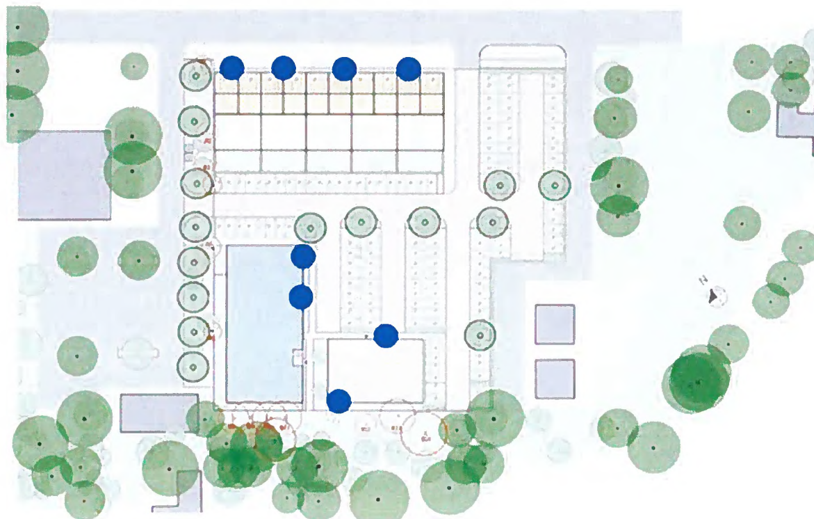
Figuur 3: Weergave van het plangebied en de locatie van de acht permanente verblijfplaatsen ten behoeve van de gewone dwergvleermuis in de omgeving van het plangebied (blauwe stippen).