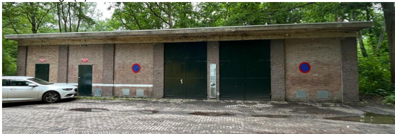
Onder: Garage (D)