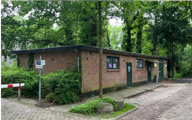
Boven: Gebouw met onbekende functie (C)