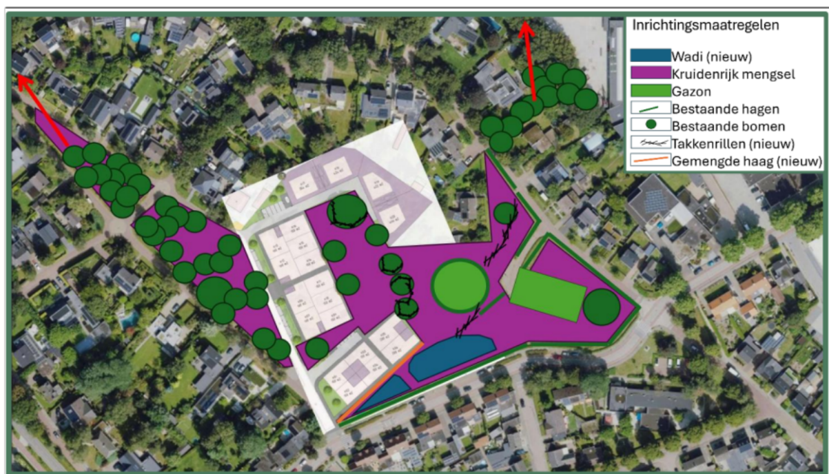
Figuur 3. Toekomstige inrichting van het plangebied.