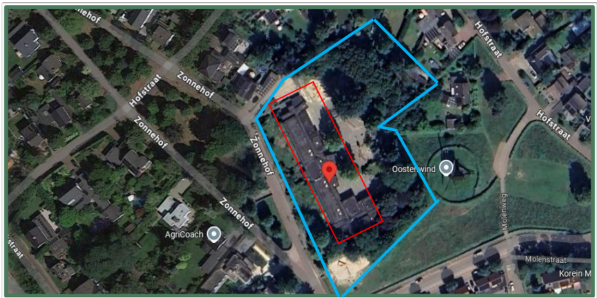
Figuur 1. Locatie Zonnehof 2, 5721 AZ te Asten. De activiteiten vinden plaats binnen het omliggende gebied.