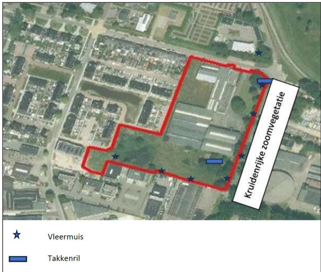
Figuur 2: De locaties van de tijdelijke vleermuispaalkasten (blauwe sterren) en takkenrillen (blauwe rechthoeken).