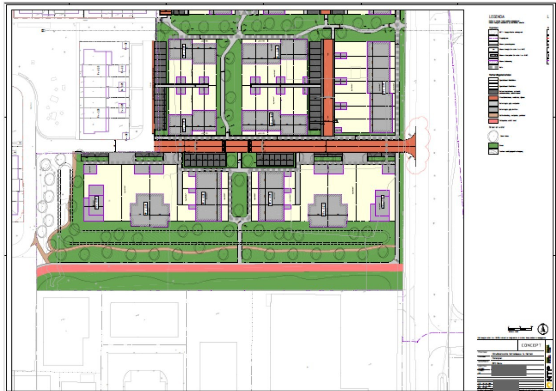
Figuur 4: Beoogde uitvoering (schets) van het plangebied. De takkenrillen komen in de groenzones te liggen. Groenzones worden zo veel mogelijk met kruidenrijke inheemse soorten uitgevoerd en waar niet nodig, blijven groenstructuren behouden.