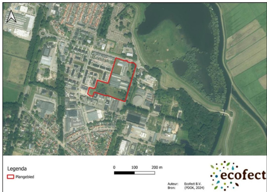
Figuur 1: Ligging van het plangebied in de omgeving van Hattem (rood omlijnd).