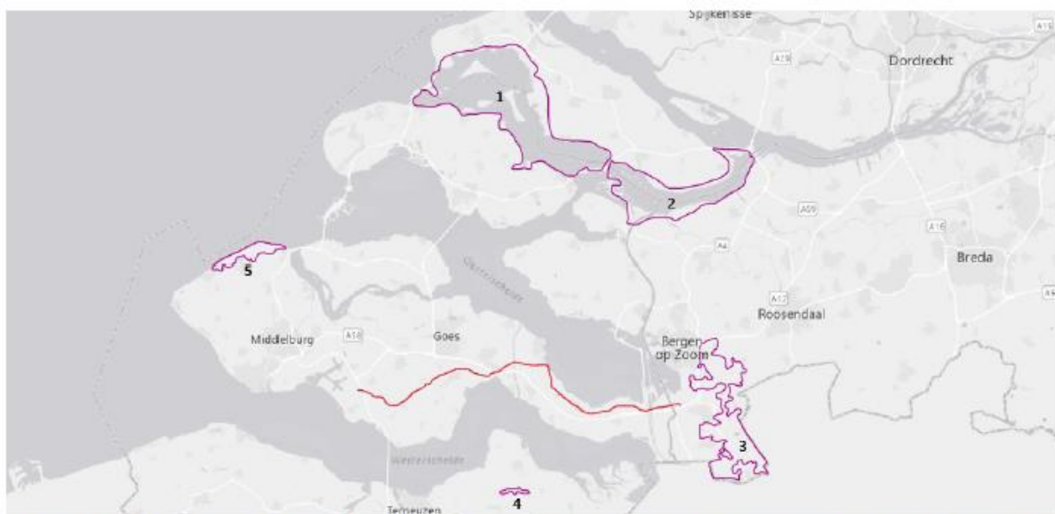
Figuur 2. Op de kaart zijn de Natura 2000-gebieden weergegeven die op grotere afstand van de werkzaamheden aan de waterleiding liggen. De waterleiding zelf is met een rode lijn aangeduid. De genummerde aanduidingen verwijzen naar de volgende vijf Natura 2000-gebieden: 1. Grevelingen, 2. Krammer-Volkerak, 3. Brabantse Wal, 4. Vogelkreek en 5. Manteling van Walcheren.