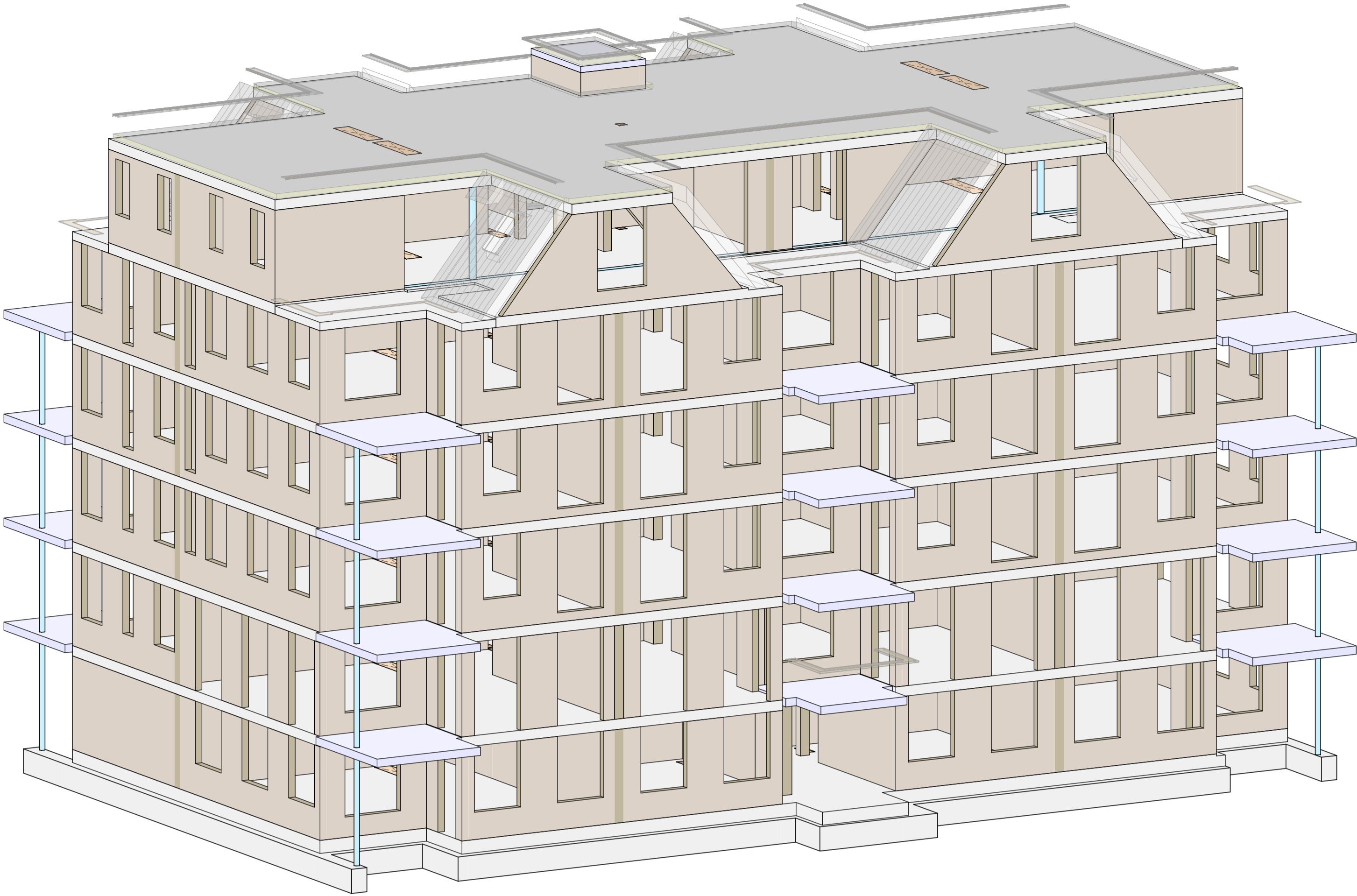
3D view 1