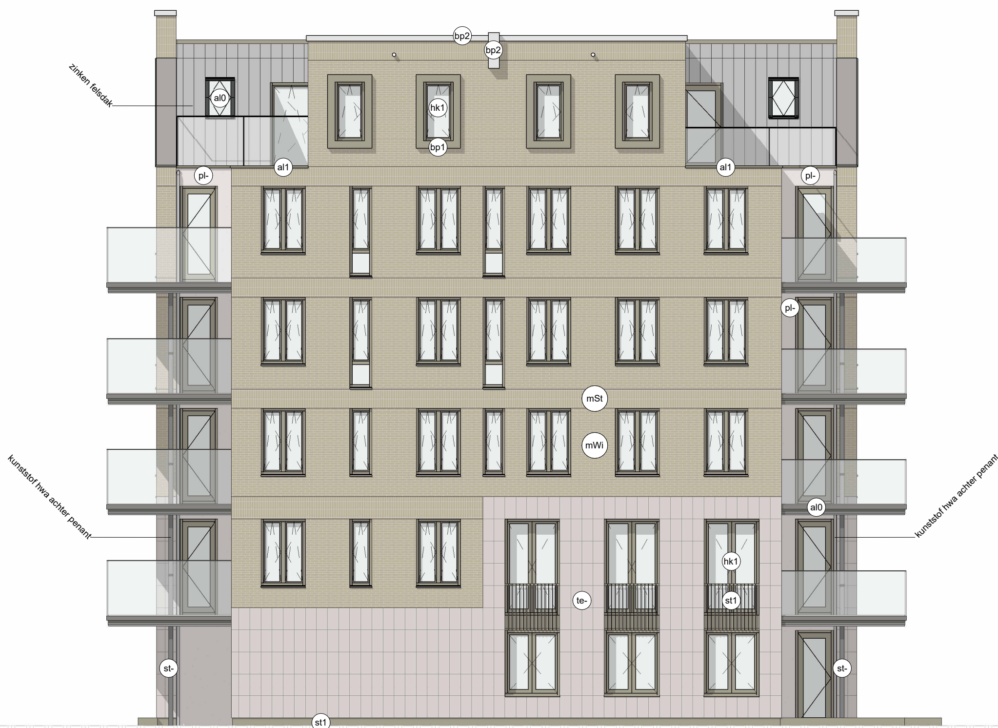
Westgevel (Linkerzijgevel) Materialen