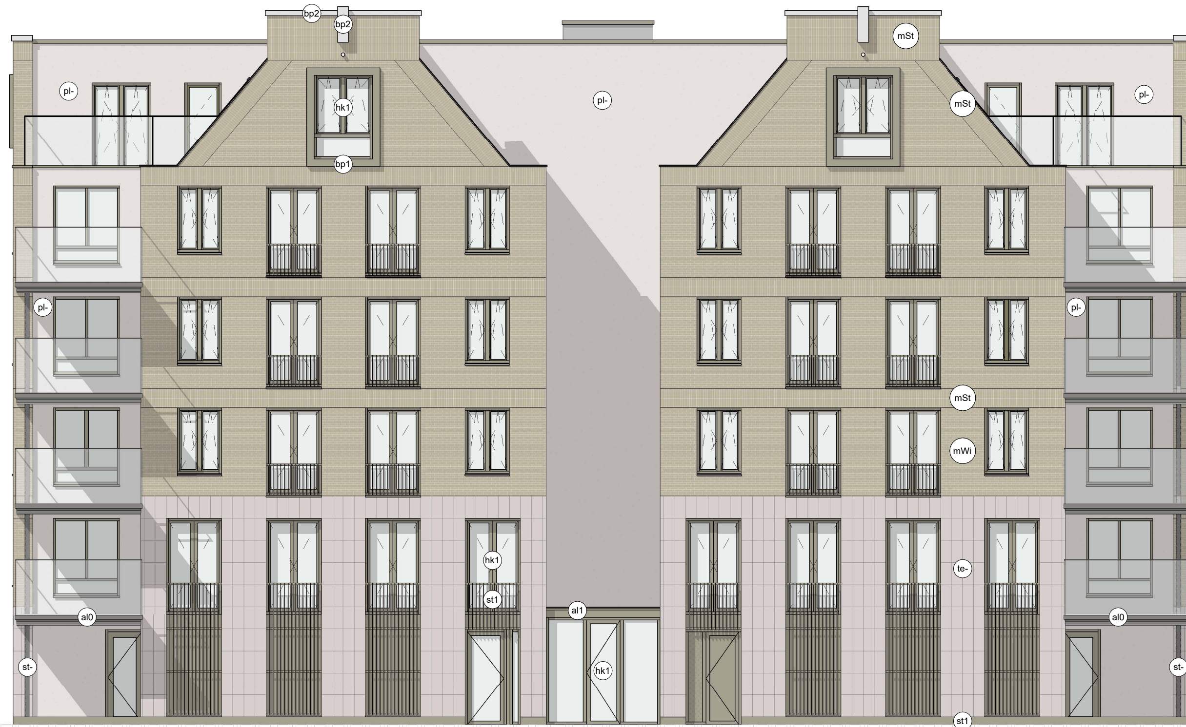
Noordgevel (Achtergevel) Materialen