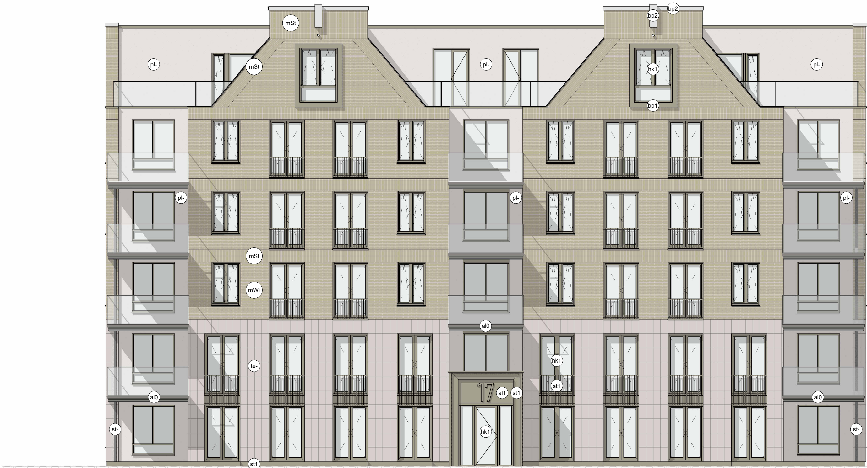
Zuidgevel (Voorgevel) Materialen