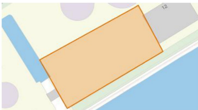
Figuur 1: de globale ligging van het projectgebied volgens de aanvraag.

Het dagelijks bestuur van het waterschap Noorderzijlvest heeft op 13 mei 2026 van [REDACTED] een aanvraag ontvangen om een omgevingsvergunning als bedoeld in afdeling 5.1, tweede lid, van de Omgevingswet (Ow). De aanvraag betreft het uitbreiden van de bestaande industriewaterzuivering nabij Grasdijkweg 12 te Garmerwolde, zoals hieronder globaal is weergegeven in figuur 1.